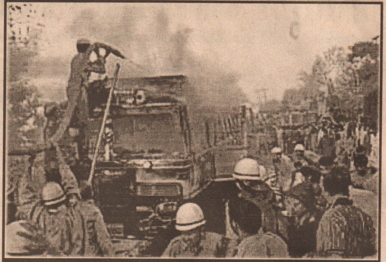
ஐம்மு அருகே பேருந்து ஒன்றில்சக்தி வாய்ந்த குண்டு வெடித்ததில் அதில் பயணம் செய்த கிருவர் பலியானார்கள். மேலும் 21 பேர் காயமடைந்தனர். பேருந்தின் எரிபொருள் நிரப்பும் டாங்கி மீது வைத்திருந்த குண்டு வெடித்ததில் பேருந்து முழுவதும் தீப்பற்றி எரிவதை படத்தில் காணலாம்.