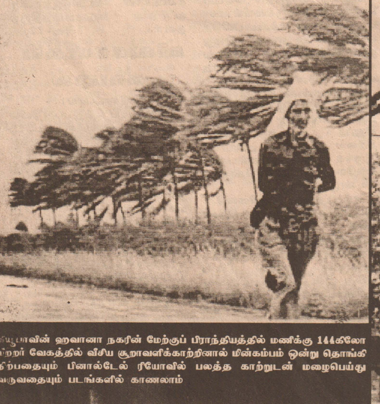
கியூபாவின் ஹவானா நகரின் மேற்குப் பிராந்தியத்தில் மணிக்கு 144கிலோமீற்றர் வேகத்தில் வீசிய சூறாவளிக்காற்றினால் மின்கம்பம் ஒன்று தொங்கி நிற்கும்படியும் பீனால்டேல் ரியோவில் பலத்த காற்றுடன் மழைபெய்து வருவதையும் படங்களில் காணலாம்

(டோக்கியோ) ஐப்பான் நாகஸாகி கப்பல் கட்டும் தளத்தில் நிர்மாணிக்கப்பட்டுக் கொண்டிருந்த ஆடம்பரப் பயணிகள் கப்பலில் தீப்பற்றிக் கொண்டது. கப்பல் தீப்பிடிக்கும் போது அங்கு ஆயிரம் வேலையாட்கள் கடமையில் ஈடுபட்டிருந்தனர். இவர்கள் அனைவரும் பாதுகாப்பாக அப்புறப்படுத்தப்பட்டனர் என தெரிவிக்கப்பட்டுள்ளது. கப்பலின் முன் பகுதி இன்னும் புலிகளுக்கு ஆதரவாகப் பேசிய