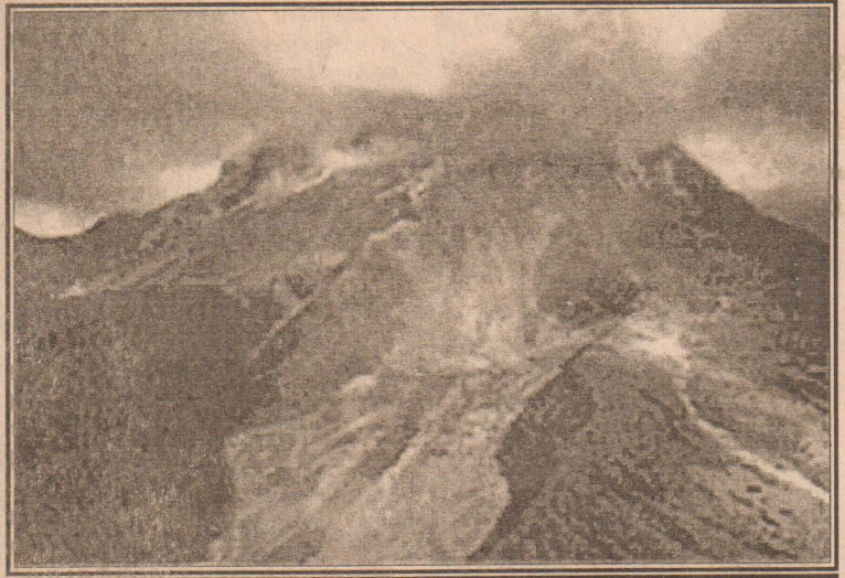
ஸ்வியின் நாட்டின் மொண்ட்லேராட் நகரில் உள்ள செளப்ரியர் மலையில் இருந்து நெருப்புக் குழம்பு வெளிவருவதைக் காணலாம். பாதுகாப்புக் கருதி அங்கு வாழ்ந்து வந்த மக்கள் தங்களது கிருப்பிடங்களை விட்டு வெறு இடங்களுக்குக் குடிபெயர்ந்துள்ளனர்.

இத்தகைய தாக்குதல் ஈராக் சர்வதேச ஆயுதப்பரிசோதகர்களை அனுமதிக்கும் விவகாரங்களைப் பாதிக்குமென ரஷ்யா அதிருப்தி தெரிவித்துள்ளது. இதேவேளை ஐக்கிய நாடுகள் பாதுகாப்புச்சபையில் அமெரிக்கா முன்வைக்கவுள்ள தீர்மானத்திற்கு சீனா, ரஷ்யா பிரான்ஸ் ஆகிய நாடுகளிடமிருந்து ஆதரவைப் பெற்றுக் கொள்வதற்காக அமெரிக்காவும் பிரித்தானியாவும் கடும் பிரயத்தனங்களை மேற்கொண்டு வருகின்றன என்பது இங்கு குறிப்பிடத்தக்கது. (சு-2)