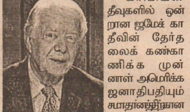
இவ்வருட நோபல் பரிசை வென்ற வருமான ஜிம்மி கார்ட்டர் நியமிக்கப்பட்டுள்ளார்.

காரியியன் தீவுகளில் ஒன்றான ஜமேக் காத்தீவின் தேர்தலைக் கண்காணிக்க முன்னர் அமெரிக்க ஜனாதிபதியும் ஔமராண்தீர்மான இவ்வருட நோபல் பரிசை வென்ற வருமான ஜிம்மி கார்ட்டர் நியமிக்கப்பட்டுள்ளார். இன்று நடைபெறவுள்ள இத்தேர்தலினைக் கண்காணிக்கத் தெரிவாகியுள்ள 60 நாடுகளின் தலைவர்களை உள்ளடக்கியுள்ள இக் குழுவிற்கு ஜிம்மி கார்ட்டர் தலைமை தாங்குவார். அண்மைக்கால தேர்தல் பிரசாரங்களில் வன்முறைகள் இடம் பெற்றாலும் நேர்மையான தேர்தலை ஐமேக்கா நடத்தும் என்று ஜிம்மி கார்ட்டர் நம்பிக்கை தெரிவித்துள்ளார். (சு-2)