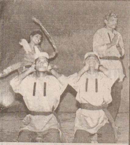
புதுவை அன்பின் கரைதேடும் ஓடங்கள் நாடகத்தின் ஒரு காட்சி

இதேவேளை, வடக்குகிழக்கு மாகாணத்தில் இடைக்கால நிர்வாக சபையொன்றை அமைக்க வேண்டும் என விடுதலைப்புலிகள் கோரியுள்ளமை எதிர்க்கட்சிகளான பொதுஜன ஜனக்கிய முன்னணியும் ஜனாதிபதியும் எதிர்த்து வருகின்றமை இங்கு குறிப்பிடத்தக்கவை. (க-10)