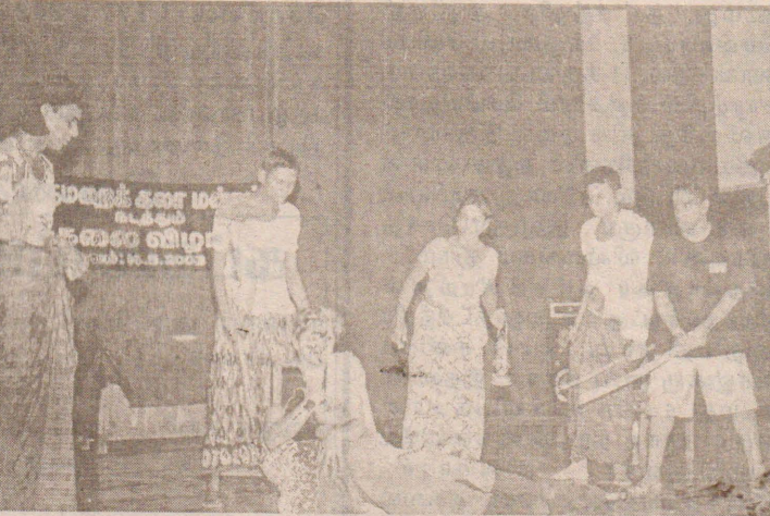
ஜெறோம் டீசில்வாவின் என்னைப்பார் (Looil atme) ஆங்கில நாடகத்தின் ஒரு காட்சி