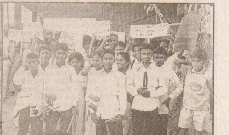
வீரசிங்கம் மண்டபத்திலிருந்து சிறுவர் எழுச்சி உள்வலம் ஆரம்பமாகும் காட்சி