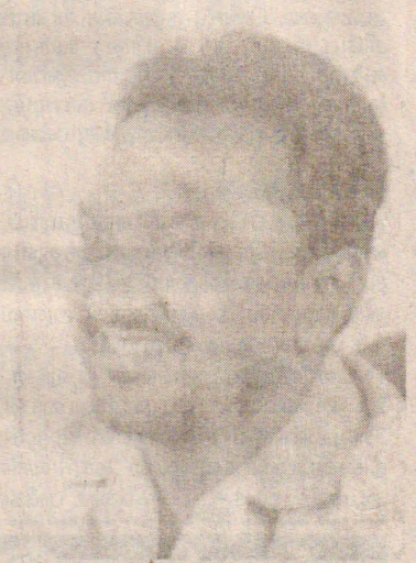
அப்போது தான் நாட்டில் மேலும் சுபீட்சமும், அமைதியும் ஏற்படுவதுடன் இனவாதச்சக்திகளின் ஆதிக்கமும் குறையும் என்றார். (தி)