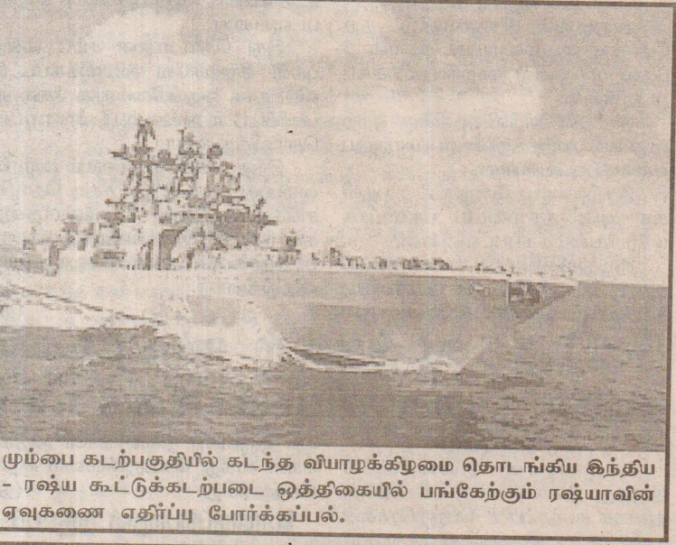
மும்பை கடற்பகுதியில் கடந்த வியாழக்கிழமை தொடங்கிய இந்திய - ரஷ்ய கூட்டுக்கடற்படை ஒத்திகையில் பங்கேற்கும் ரஷ்யாவின் ஏவுகணை எதிர்ப்பு போர்க்கப்பல்.

அடுத்தமாதம் நடுப்பகுதி முதல் நாளொன்றிற்கு 1.3முதல் 1.5மில்லியன் பீப்பாய்கள் வரை எண்ணெய் உற்பத்தியை மேற்கொள்ள ஈராக் உத்தேசித்துள்ளமை இங்கு குறிப்பிடத்தக்கது. (க-9)