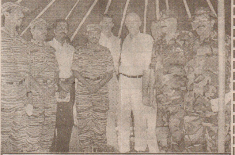
மூதுர் கட்டைப் பறிச்சானில் விடுதலைப் புலிகளுடன் கிராணுவத்தினரும் கண்காணிப்புக் குழுவினரும் சந்தித்த போது...

துள்ள இடைக்கால நிர்வாக சபை தொடர்பாக ஸ்ரீலங்கா சுதந்திரக் கட்சியின் மத்திய குழு நேற்றுக் கூடி ஆராய்ந்த போதே மேற்கண்டவாறு நிராகரித்து தீர்மானம் நிறைவேற்றி உள்ளது. அத்தீர்மானத்தில் மேலும் தெரிவிக்கப்பட்டிருப்பதாவது; ஜனாதிபதி சந்திரிகா குமாரதங்கா (10ம் பக்கம் பார்க்க)