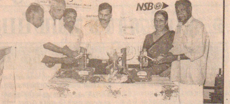
பருத்தித்துறை தேசிய சேமிப்பு வங்கியில் நடைபெற்ற முதலீட்டாளர் "கௌரவ" சேமிப்புக் கணக்கு ஆரம்ப விழாவை முதலீட்டாளர்கள் மங்கள விளக்கேற்றி ஆரம்பித்து வைக்கின்றனர். (பகு. நிருபர்)