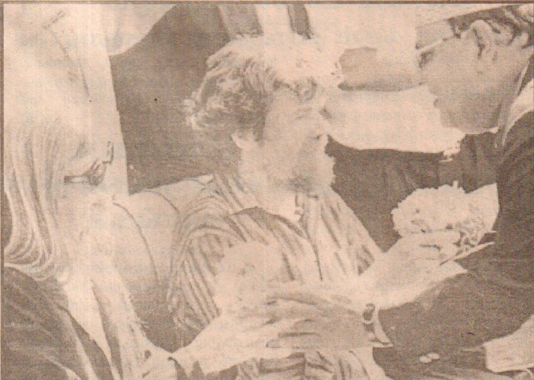
எவரெஸ்ட் சிகரத்தை அடைந்த 50 ஆண்டுகள் நிறைவை யொட்டி காத்மண்டூவில் நடைபெற்ற விழாவில் கித்தாலியைச் சேர்ந்த ரீன்ஹோல்ட் மெல்செனர் உடன் அவருடைய மனைவி முதன் முதலாக ஒப்ச்சன் கில்லாமல் எவரெஸ்ட் சிகரத்தில் ஏறிச் சாதனை படைத்த இருவரையும் படத்தில் காணலாம்.

தொடர்ந்து நேற்று முன்தினம் ஏற்பட்ட பூமியதிர்ச்சி 5.8 ரிச்ச்டர் அளவைக் கொண்டதாகப் பதியப்பட்டுள்ளது. இதேவேளை, அல்ஜீரியாவில் கடந்தவாரம் ஏற்பட்ட பாரிய பூமியதிர்ச்சியில் இரண்டாயிரத்திற்கும் மேற்பட்டோர் உயிரிழந்தமையும், கட்டட இடிபாடுகளுக்குள் இன்னும் பலரது சடலங்கள் இருப்பதற்கான அறிகுறிகள் காணப்படுவதாக மீட்புப் பணியாளர்கள் கூறியிருப்பதும் இங்கு குறிப்பிடத்தக்கது. (உ-9)