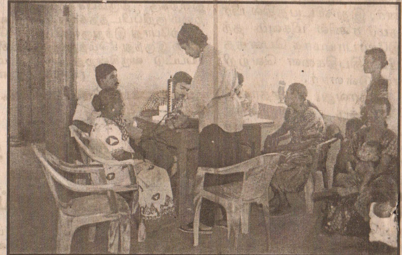
தமிழ் சுகாதார சேவையினரும் நோய்த்தடுப்பு பிரிவினரும் தயாகிதல்பின் ஞாபகார்த்த மருத்துவக் குழுவினரும் உள்காவற்குறை மெலிஞ்சீமுனைப் பகுதி மக்களுக்கு கொலரா நோய்த்தடுப்பு சிகிச்சை அளிக்கின்றனர்.