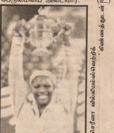
செர்னா வில்லியம்ஸ் வெற்றிக் கண்டனத்துடன்

அடுத்த ஆண்டு நடைபெறும் அவுஸ்ரேலிய ஓபன் போட்டியில் செர்னா சம்பியன் பெறும் பட்சத்தில் ஸ்டெபிகிராபை தொடர்ந்து நான்கு கிராண்ட் ஸ்லாம் ஓற்றையப் பட்டத்தை பெறும் வீராங்கனை என்ற பெருமையை அடைவார். (உ-)