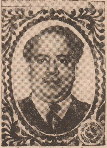
ஆட்சிக் காலத்தில் சிறுவர்கள் எவரும் பிச்சை எடுக்காது சுய முயற்சியில் ஈடுபட்டிருந்தனர் என்பது வரலாற்று நிகழ்வாகும்.

மக்களாட்சி மலர், மக்களைப் பிடித்துள்ள பழமை மடிய, சாதிச் சமூக ஒழிப்பு, பெண்கள் சமநிலை அடைய, ஏழைகள் உயர், தொழிலாளர்கள் நன்மை பெற, மூட நம்பிக்கை அகற்றி, சண்மூடிப் பழக்க வழக்கங்கள் நீங்கிட அவற்றை ஆணிவேரோடு கழைந்திட அருட்பாட்டுடவர் அறிஞர் அண்ணா. இவற்றிற்காக அவர் ஊதிய சங்கநாதம் 1967 இல் அவரை அரசு கட்டடில் அமர்த்தியது. ஓராண்டுதான் அவர் ஆட்சியில் இருந்தார்; ஆனால், ஆரும் ஆற்றொணாத அரிய செயல்கள் பலவற்றைச் செய்து அழியாப் புகழைத் தேடிக்கொண்டார்.