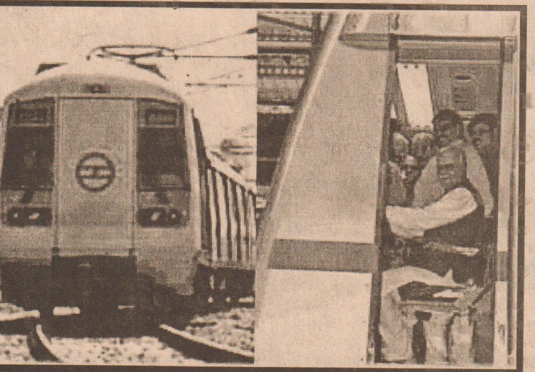
டெல்லியில் மெட்ரோ ரயிலை சோதனை ஓட்டமாக துவக்க வைத்தார் குணைப் பிரதமர் எல்.கே.அத்வானி.

குறித்துத் திட்டம் எதுவும் இதுவரை எடுக்கப்படவில்லை. இதேவேளை, பிரிட்டிஷ் வெளியுறவுச்செயலர் ஈராக்மீது தாக்குதல் நடத்தப்பட வேண்டுமென ஐக்கிய நாடுகள் சபையில் பேசியதை பிரிட்டிஷ் பாராளுமன்ற உறுப்பினரான எலைஸ் மாஹென் எதிர்த்துள்ளார். ஈராக் தாக்கப்படுவதை எதிர்த்து வாக்களிக்க தொழிற்கட்சி உறுப்பினர்கள் சுமார் 100பேர் தயாராக இருப்பதாகவும் அவர் தெரிவித்துள்ளார். (உ - 3)