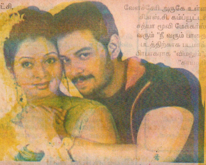
வேளச்சேரி அருகே உள்ள சி.எஸ்.சி. கம்ப்யூட்டர் சத்யா மூவி மேக்கர்ஸ் வரும் "நீ வரும் பாளை படத்திற்காக படமாக்க பிரபாகராக "விம்லும்", "காய்திரி ஜெயராமனும்".