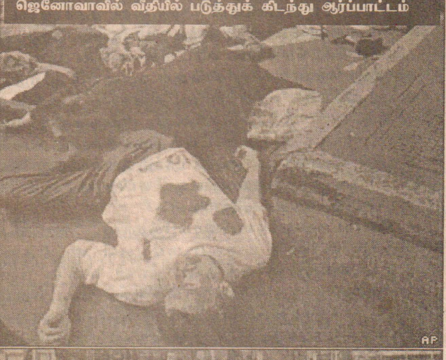
ஜெனோவாவில் வீதியில் படுக்குக் கிடந்து ஆர்ப்பாட்டம்