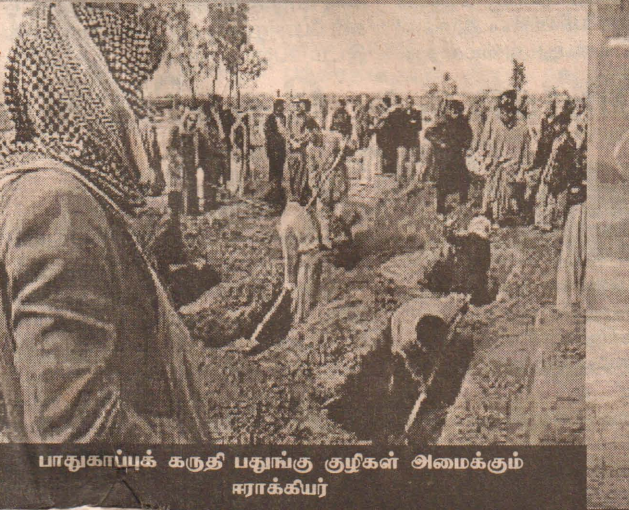
பாதுகாப்புக் கருதி பதுங்கு குழிகள் அமைக்கும் ஈராக் கியர்