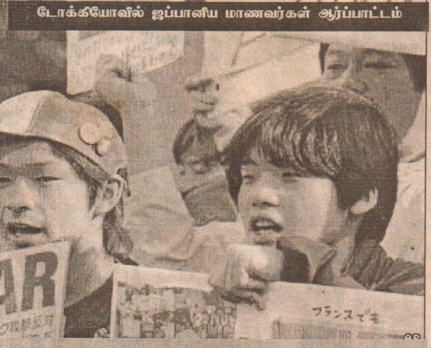
டோக்கியோவில் ஜப்பானிய மாணவர்கள் ஆர்ப்பாட்டம்