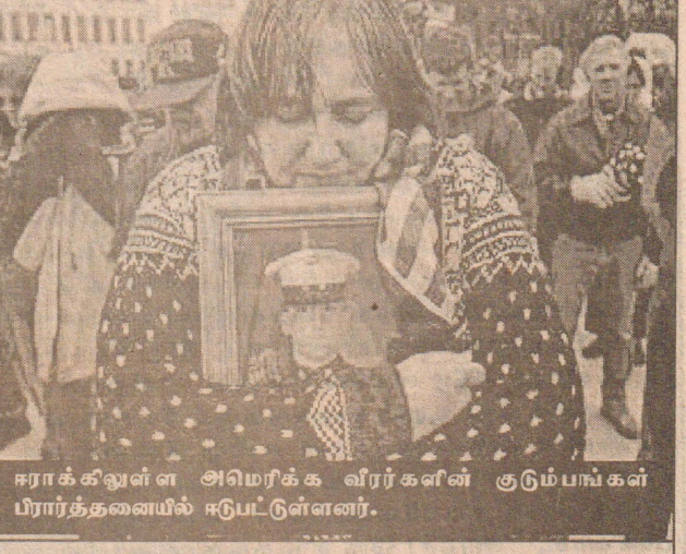
ஈராக் கிணுள்ள அமெரிக்க வீரர்களின் குடும்பங்கள் பிரார்த்தனையில் ஈடுபட்டுள்ளனர்.