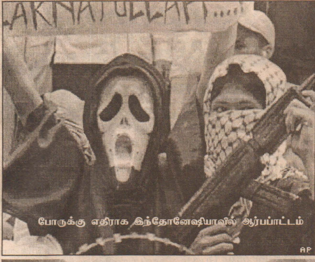
போருக்கு எதிராக இந்தோனேஷியாவில் ஆர்ப்பாட்டம்