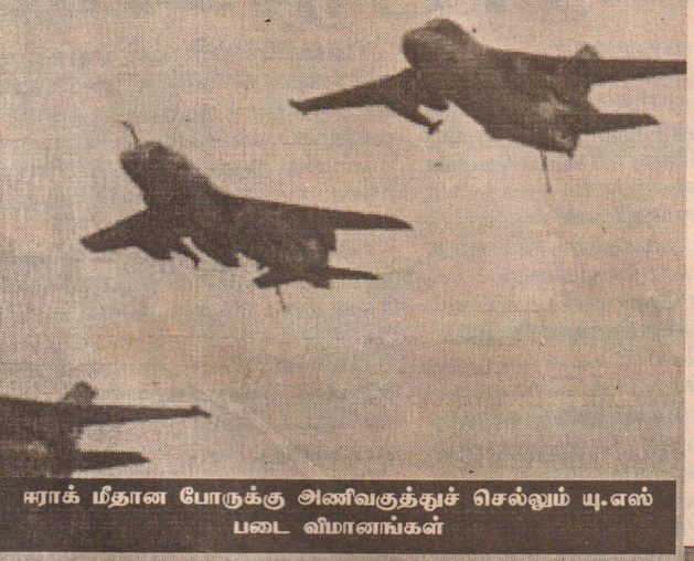
ஈராக் மீதான போருக்கு அணிவகுத்துச் செல்லும் யு.எஸ் படை விமானங்கள்