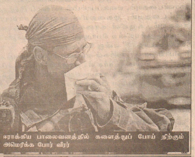
ஈராக் கிய பாலைவனத்தில் களைத்துப் போய் நிற்கும் அமெரிக்க போர் வீரர்