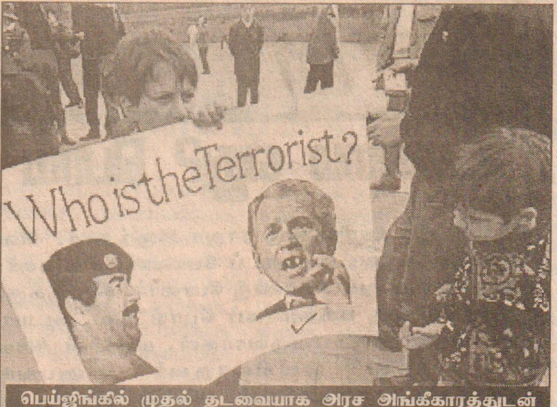
பெய்ஜிங்கில் முதல் தடவையாக அரசு அங்கீகாரத்துடன் நடந்த ஆர்ப்பாட்டம்.

சர்வதேச விதிகளை பிரிட்டிஷ் படைகள் கட்டாயம் கடைப்பிடிக்க வேண்டும் என்று பிளேயரிடம் அக்குழு வற்புறுத்தியது. மேலும் அமெரிக்கக் கூட்டணிப்படைகளிடமிருந்தும் இதே போன்ற உறுதிமொழியை பிளேயர் பெற வேண்டும். அதற்கான செல் வாக்கை பிளேயர் பயன்படுத்திக் கொள்ள வேண்டும் என்றும் குழு கோரிக்கை விடுத்தது. இத்தகவலை சர்வதேச பொது மன்னிப்பு அமைப்பின் தலைமைச் செயலர் ஐரீன் கான் தெரிவித்தார். உலகம் முழுவதும் உள்ள 16 லட்சம் உறுப்பினர்களின் சார்பில் இந்த மனு அளிக்கப்படுகிறது என்றார் அவர். (பி)