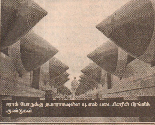
ஈராக் போருக்கு தயாராகவுள்ள யு.எஸ் படையினரின் பீரங்கிக் குண்டுகள்