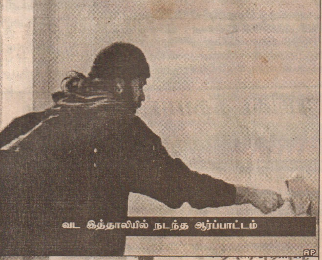
வட இத்தாலியில் நடந்த ஆர்ப்பாட்டம்