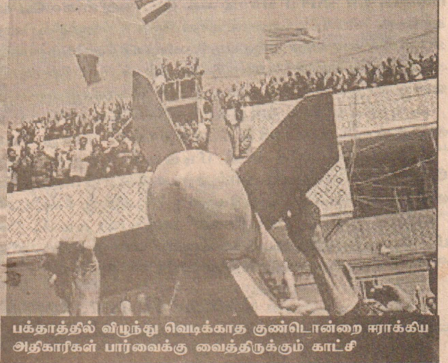
பக்தாத் தில் விழுந்து வெடிக்காத குண்டிடான்றை ஈராக் கிய அதிகாரிகள் பார்வைக்கு வைத்திருக்கும் காட்சி