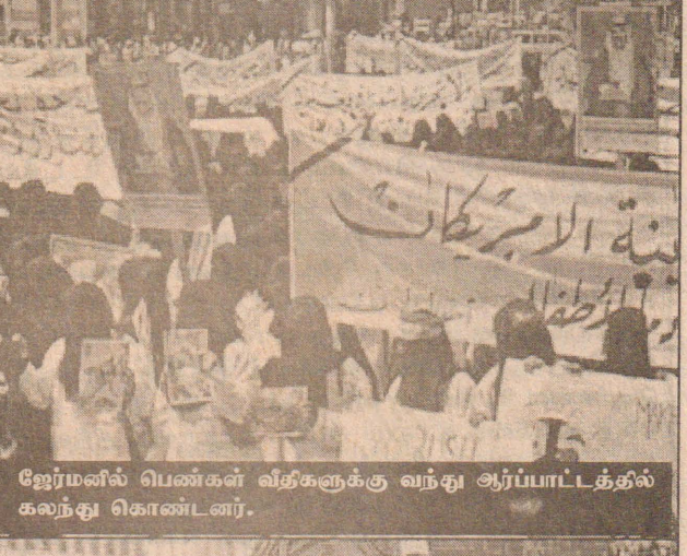
ஜேர்மனில் பெண்கள் வீதிகளுக்கு வந்து ஆர்ப்பாட்டத்தில் கலந்து கொண்டனர்.