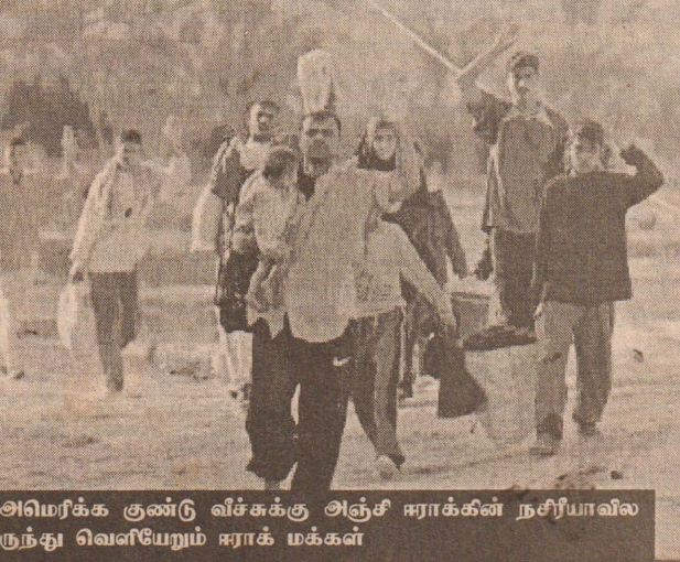
அமெரிக்க குண்டு வீச்சுக்கு அஞ்சி ஈராக்கின் நகரிலாவில் ருந்து வெளியேறும் ஈராக் மக்கள்