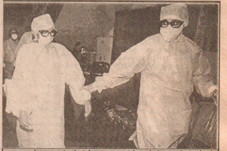
மகாராஷ்டிர மாநிலத்தின் புனே நகரில் சார்ல்ஸ் நோய் தாக்கப்பட்ட அண்ணன், தங்கை இருவரும் அங்குள்ள டாக்டர் நாயுடு தொற்றுநோய் மருத்துவமனைக்கு மிகவும் பாதுகாப்பாக அழைத்துச் செல்லப்பட்டனர். அங்கு அவர்களுக்கு தீவிர சிகிச்சை அளிக்கப்பட்டு வருகிறது. புனையில் மேலும் பலருக்கு சார்ல்ஸ் பரவியிருப்பது கண்டு பிடிக்கப்பட்டுள்ளது.

இதேவேளை, ஈராக்கின் தேசிய காங்கிரஸ் தலைவர் டாக்டர் அகமட் ஷலாபி, ஈராக்கில் ஜனநாயகத்தை ஏற்படுத்துவதற்காக, புதிய தலைமையே அரசியல் சாசனத்தை வரையும் என்று கூறிய இவர், மக்களுக்கு அத்தியாவசியப் பொதுத் தேவைகளை வழங்குவதற்காக இடைக்கால ஆட்சி அமைக்கப்பட்டு என்றும் மேலும் கூறியுள்ளார். (பி-2)