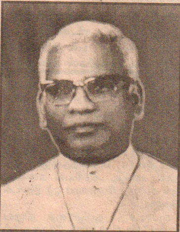
மேல் என்றமே வேண்டாம். பேசுவதைச் செயற்படுத்துங்கள். பேச்சுவார்த்தையைத் தொடருங்கள் என்ற வேண்டுகோளை அரசுக்கும் புலிகளுக்கும் இவ்வேளையில் அவசரமாக தமிழ் மக்கள் அனைவர் போராலும் விடுக்க விரும்புகின்றோம் என்று குறிப்பிடப்பட்டுள்ளது. (உ-)

தையும், வேதனையையும், அதிர்ச்சியையும் ஏற்படுத்தியுள்ளது. பேச்சுவார்த்தை ஒரு இருவழிச் செயற்பாடு. இரு தரப்பினரும் மனம் திறந்து இதய சுத்தியோடு தமிழ் மக்களின் சுபீட்சமான எதிர்காலத்தினை கருத்திற் கொண்டு பேச்சுக்களை நடத்த வேண்டும். பேசுவற்றை இரு தரப்பினரும் உடனடிமுறைப்படுத்தல் வேண்டும். செயற்பாடு இன்றி தொடர்ந்து பேசிக் கொண்டே இருப்பதனால் எந்தப் பயனும் இல்லை. புரிந்துணர்வு ஒப்பந்தம் கைச்சாத்திட்டு ஓராண்டு கடந்த பின்னரும் பல அடிப்படையிலான களிலும் இயல்பு வாழ்விலும் முன்னேற்றமும் மாறுதலும் ஏற்படாமலிருப்பது தமிழ் மக்கள் மனதுகளில் ஏற்கனவே விசனத்தையும் குழப்ப நிலையையும் பேச்சுவார்த்தையில் நம்பிக்கையில்லாத தன்மையையுமே ஏற்படுத்தியுள்ளது. இது இறுதியில் பேச்சுவார்த்தைகளில் ஈடுபட்ட இரு தரப்பினருக்குமிடையில் ஐயப்பாட்டையும் நம்பிக்கையில்லாத தன்மையையுமே தோற்றுவிக்கும். இந்த நிலையில் யுத்தம் இனி