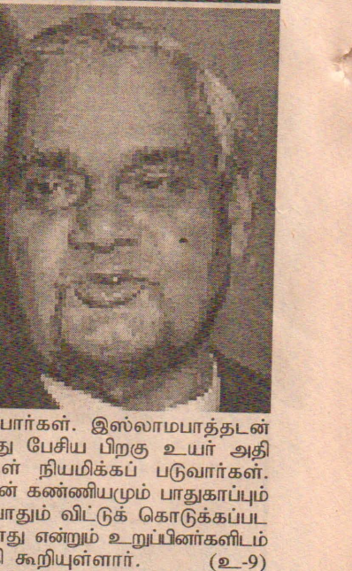
காண்பார்கள். இஸ்லாமாபாத் தன் கலந்து பேசிய பிறகு உயர் அதிகாரிகள் நியமிக்கப் படுவார்கள். நாட்டின் கண்ணியமும் பாதுகாப்பும் ஒருபோதும் விட்டுக் கொடுக்கப்பட மாட்டாது என்றும் உறுப்பினர்களிடம் உறுதி கூறியுள்ளார். (உ-9)

பிரச்சினை தீர்ந்து விடும் என்றார். இதேவேளை, ஈராக்கின் அமெரிக்க நிர்வாகி ஜெனரல் ஜே கார்னரின் உரை அவ்வளவு முக்கியமானது அல்ல எனப் புறக்கணித்துள்ளார். இம்மாதம் ஐ.நா பாதுகாப்பு சபையில் தலைமைப் பொறுப்பை ஏற்கவுள்ள பாகிஸ்தான் காஷ்மீர் பிரச்சினையை ஐ.நா பாதுகாப்புச் சபையில் எழுப்பப் போவதாக மிரட்டியிருப்பதாகவும் வாஜ்பாய் தனது உரையில் நிராகரித்துள்ளார். காஷ்மீர் பிரச்சினைக்கு சிம்லா ஒப்பந்தத்தின் படி இரு தரப்பாகத் தான் தீர்வு காண வேண்டும் என்று குறிப்பிட்டார். புதிய சகாப்தத்தின் தொடக்கமாக இந்தியாவிற்கும் பாகிஸ்தானிற்கும் இடையே விளையாட்டுத் தொடர்புகளை மீண்டும் ஏற்படுத்தலாம் என்றும், பிரதமர் யோசனை கூறியுள்ளார். இது பற்றி இருநாடுகளின் விளையாட்டுத்துறை நிர்வாகிகள் தீர்வு