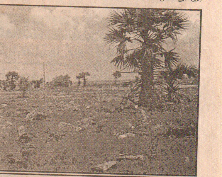
முகாம் அமைப்பதற்கான முயற்சிகள் இடம்பெற்றுவரும் யாழ். கோட்டையின் மேற்கு புற நல்புரப்பினை படத்தில் காணலாம்.

காக விண்ணப்பிக்கலாம். கடந்த ஆண்டு வெளியான பிரதிகள் இவ்விருதுக்காக தெரிவு செய்யப்படவுள்ளன. நிறுவனத் தலைவரின் அத்தாட்சியுடன் கூடிய விண்ணப்பத்தை இம்மாதம் 31 ஆம் திகதிக்கு முன்னர் சுகாதாரக் கல்விப் பணிமனையின் பணிப்பாளருக்கு அனுப்பி வைக்குமாறும் கேட்கப்பட்டுள்ளது. (தி)