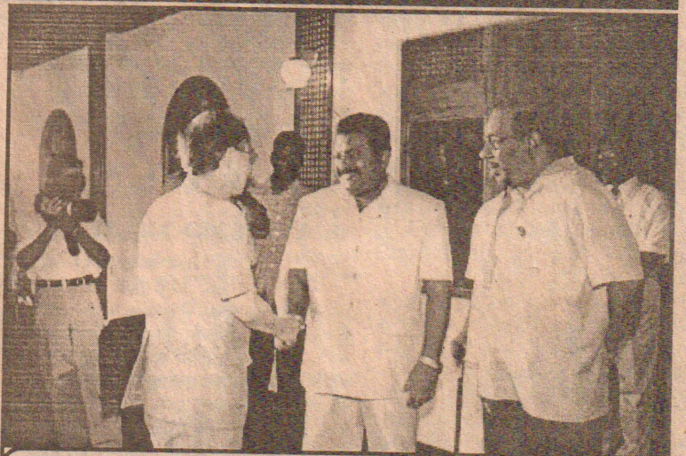
நேற்றைய சந்திப்பில் ஐப்பான் தூதுவர் அகாஷியை தலைவர் பிரபா கைலாக கொடுத்து வரவேற்கும் காட்சி.

பொறுத்த வரையில் கடந்த 50 வருடங்களாக தொடர்ச்சியாக பேச்சுவார்த்தைகளில் ஈடுபட்டிருந்தபோதும் எந்த ஒரு அரசாங்கமும் அப்பேச்சுவார்த்தைகளில் எடுக்கப்பட்ட தீர்மானங்கள் தொடர்பாக எந்தவித நடவடிக்கைகளையும் எடுக்கவில்லை. இதே நிலைமை எமக்கு ஏற்படக் கூடாதென்பதாலேயே பேச்சுவார்த்தையை தற்காலிகமாக இடைநிறுத்திவைத்துள்ளோம். இது நாம் (10ம் பக்கம் பார்க்க)