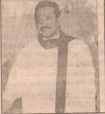
எடுக்கப்பட்ட தீர்மானம். இதனை எதிர்ப்பவர்கள் தேவையானால் நீதிமன்றத்துக்கு செல்லலாம் என எதிர்க்கட்சித் தலைவர் மேலும் தெரிவித்துள்ளார். (உ-5)

அபிவிருத்தி லொத்தர் சபை ஜனாதிபதி பொறுப்பேற்கும் தீர்மானத்துக்கு பொ.ஜ.ஐக்கிய முன்னணியின் நிறைவேற்றுச்சபை ஆதரவு தெரிவித்துள்ளதுடன், எதிர்வரும் காலத்தில் எடுக்கப்படும் எந்தத் தீர்மானத்திற்கும் அச்சபை அங்கீகாரம் வழங்கவுள்ளது. அபிவிருத்தி லொத்தர் சபையை பொறுப்பேற்பதற்கான தீர்மானம் அரசியல் தீர்மானம் அல்ல. அது தேசிய முக்கியத்துவத்தின் அடிப்படையில்