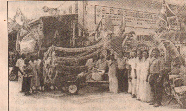
கிரண்டாவது உலக இந்து மாநாடு தொடர்பில் கட்ட. நெ. ப.நோ.கூ. சங்கத்தால் ஒழுங்கு செய்யப்பட்ட ஊர்திப் பவனியில் பங்கேற்ற, சங்கப்பணியாளர்கள், பணிப்பாளர்களைக் காணலாம்.