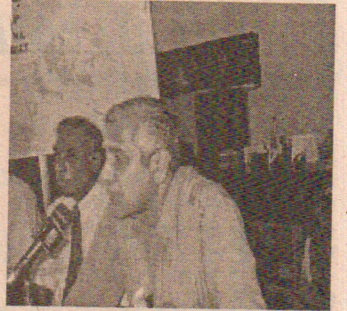
பிரதேசத்தில் மற்றைய நாடுகளிலும் பார்க்க மிகுந்த அனுபவம் வாய்ந்த ஒன்றாகும். ஒரு சில அனுபவங்கள்

இங்கிலாந்து ஆகிய நாடுகள் புலிகளை தடைசெய்திருந்தும் கூட டோக்கியோ மாநாட்டில் புலிகளுடன் அவர்களும் பங்கு பற்றுகிறார்கள். மேலும் நீர் குறிப்பிட்ட இலங்கைக்கு சமாதான திட்டங்கள் உட்பட தனது செல்வாக்கைப் பிரயோகித்த வருகிறது என்று. இந்தியா இப்