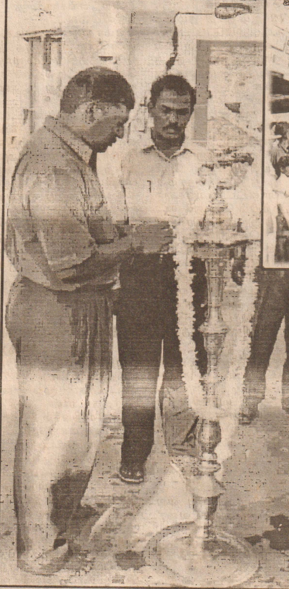
கரும்புலி தின நிகழ்வை ஆரம்பிக்க மங்கள விளக்கேற்றல்...