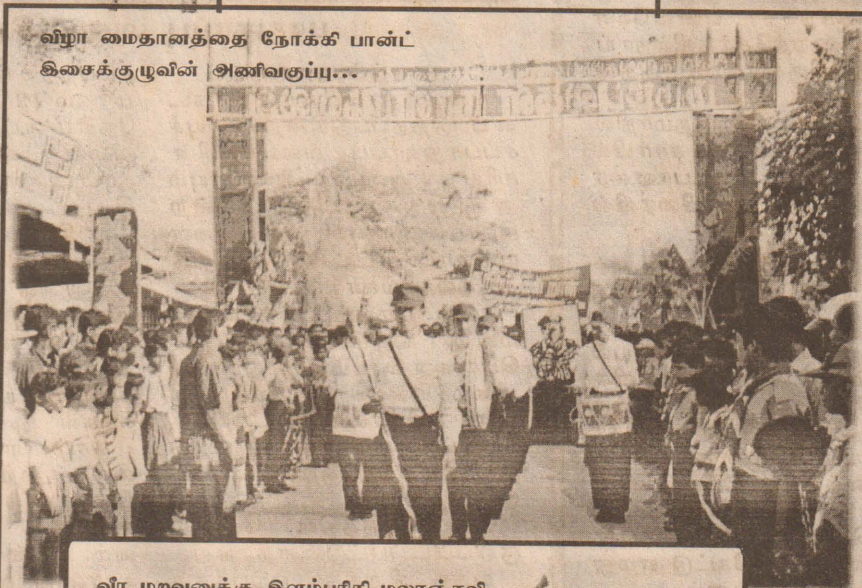
விழா மைதானத்தை நோக்கி பான்ட் இசைக்குழுவின் அணிவகுப்பு...