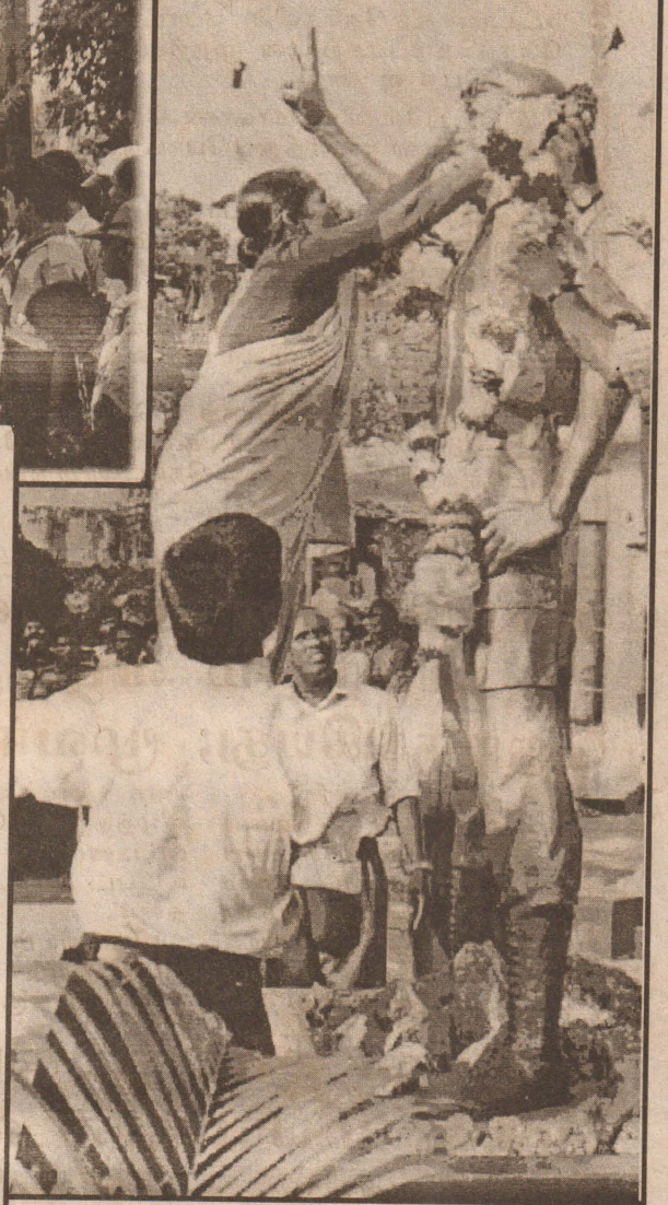
வீர மைந்தன் கரும்புலி மல்லுக்கு அன்னை மாலையணிந்து அஞ்சல் செலுத்துகிறாள்...