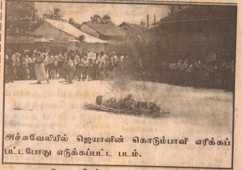
அச்சவேலியில் ஜெயாவின் கொடும்பாவி எரிக்கப் பட்டபோது எடுக்கப்பட்ட படம்.

இத் துப்பாக்கிச் சூட்டுச் சம்பவத்தை அடுத்து வெல்லாவெளிப் பிரதேசத்தில் உள்ள மக்கள் மத்தியில் பதற்றம் நிலவுகின்றது. (08ம் பக்கம் பார்க்க)