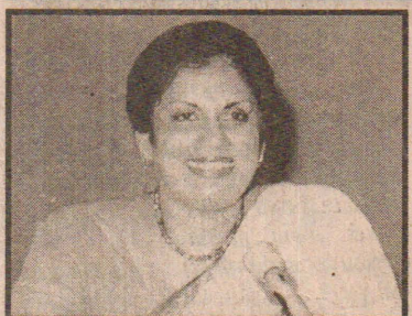
(கொழும்பு) நாட்டில் தற்போது எழுந்துள்ள சூழ்நிலையில் அரசாங்கத்தைக் கைப்பற்றும் எண்ணம் எதுவும்