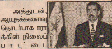
அத்துடன், ஆயுதக்களவை தொடர்பாக ஈராக் கின் நிலைப்பாட்டை அறியத்தருமாறு ஈராக் அரசாங்கத்திடம் கடிதம் மூலம் கேட்டுள்ளதாகவும், அதற்கான பதிலை எதிர் பார்த்திருப்பதாகவும் கோபிஅனான் தெரிவித்துள்ளார்.

அத்துடன், சதாம் ஹுசைனைப் பொறுத்தமட்டில் ஈராக்பாராளுமன்றம் வெற்றிப்பார் முத்திரை எனவும் புஷ்தெரிவித்துள்ளார். இதேவேளை ஈராக்பாராளுமன்றம் அதன் நாட்டு மக்களுக்காகவே குரல் எழுப்பியுள்ளது. ஐக்கிய நாடுகள் சபைக்கு அது குறித்து நேரடியாக தெரிவிக்கவில்லை என கோபிஅனான் கூறியுள்ளார்.