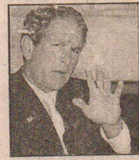
(நியூஜோர்க்) ஐக்கிய நாடுகள் பாதுகாப்புச் சபை ஈராக் ஆயுதக்களவை தொடர்பாக நிறைவேற்றியுள்ள தீர்மானத்தை அந்நாட்டின் பாராளுமன்றம் நிராகரித்திருப்பதை ஏற்றுக்கொள்ள முடியாதென ஐ.நா. செயலாளர்

தவறினால் தாக்குதல் நிச்சயம் என்கிறார் புஷ்