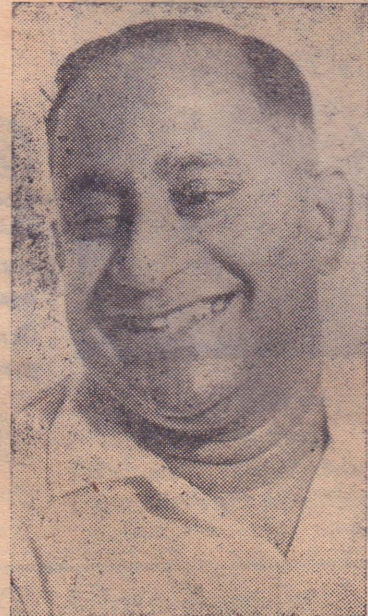
திடமாகக் கடைப்பிடிக்கும் வர்க்கப் போராட்டக் கொள்கைகளையே என்பது தெளிவு.

டாவதாக, என்னைத் தற்காலிகமாக நீக்கி, வெளியேற்றவேண்டும் என்று தீர்மானித்தது, முந்தியதைவிட கஷ்டமான பாரதூரமான வெள்ளவத்தை ஆலைத் தொழிலாளர்களின் 108 நாள் போராட்டத்தை முன்னின்று நடத்தும் வேளையில் என்பதையும் மறந்துவிட முடியாது. இரண்டு சந்தர்ப்பங்களிலும், தொழிலாளர்களின் பலத்தைக் குறைத்து எதிரிகளின் (அரசாங்கத்தினதும், முதலாளிகளினதும்) பலத்தைக் கூட்டினீர்கள். நீங்கள் தாக்குவது என்மையல்ல. நான்