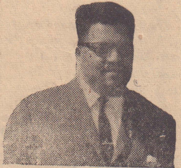
"ஜோன்சன் ஆட்சிக்கெதிராக மக்கள் யுத்தம்" - சிம்ம கர்ஜனை புரியும் ரூபர்ட்

அமெரிக்க நீக்ரோக்கள், அமெரிக்க ஏகாதிபத்தியத்தின் நிற வெறிக் கெதிராக நடத்தும் நியாயமான போராட்டத்திற்கு ஆதரவாக தோழர் மா சே-துங், 1963 ஆகஸ்ட் 8-ம் திகதி வெளியிட்ட அறிக்கையின் 4-வது ஆண்டை முன்னிட்டு ஆபிரிக்க-அமெரிக்கர்களின் புரட்சிகரத் தலைவரும், பொங்கியெழும் கறுப்பு மக்களின் போராட்டத்திற்குப் புரட்சிகரத் தெம்பளிப்பவருமான ரூபர்ட் எப். வில்லியம்ஸ் விடுத்த அறிக்கை.