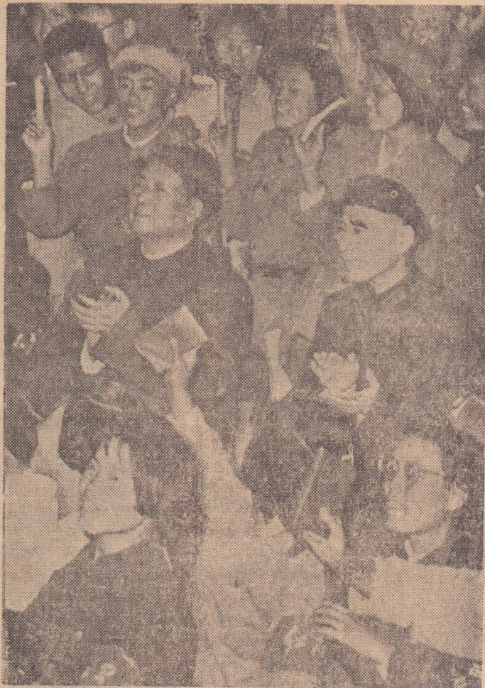
மகத்தான தொழிலாளி வர்க்க கலாசாரப் புரட்சி நடத்தும் சினத்து வாலிபர்களின் மத்தியில் தோழர் மாஓ.

அல்பேனிய கட்சி, அரசாங்கப் பிரதிநிதி குழுவினதும் அல்பேனிய கம்யூனிஸ்டுகளினதும் அல்பேனிய மக்கள் அனைவரதும் சார்பாகவும், எம் தலைவர் தோழர் அன்வரஹோ ஜாவின் பெயரிலும் இச்சந்தர்ப்பத்தில் புரட்சிகர தொழிலாளர்களும் செங்காவலர்களும் ம. வி. சே. பிரதிநிதிகளும் டஸினின் புரட்சிகர இயங்குனர்களும் ஷான்றும் மாகாணத்தின் புரட்சிகர மக்கள் அனைவருமான உங்களுக்கு எமது இதய பூர்வமான கம்யூனிஸ்ட் மரியாதையைச் செலுத்தவும், உங்களுக்கு மகத்தான தொழிலாளி வர்க்க கலாசாரப் புரட்சியில் பூரண வெற்றியீட்ட வாழ்த்தவும் என்னை அனுமதிபுங்கள். உங்கள் நாட்டுக்கு எமது பிரதிநிதி குழுவின் விஜயம்