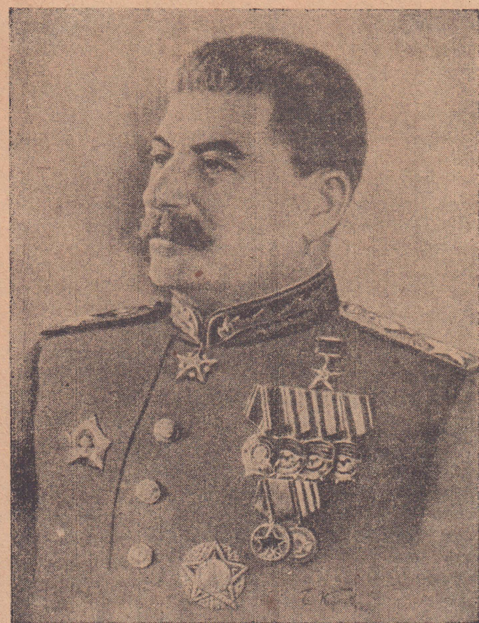
அல்பேனிய விடுதலைக்கு உறுதுணையாக நின்ற தோழர் ஸ்டாலின்

பரிசாகத் தருவார். என எண்ணிக் காத்திருக்கக் கூடாது. ஏகாதிபத்தியத்தைப் பற்றி எவ்வித மயக்கமும் கொள்ளக்கூடாது. அதன் ஏமாற்று வார்த்தைகளை ஒரு போதும் கணக்கில் எடுக்கக் கூடாது என்பனவற்றை எமது அனுபவங்கள் காட்டுகின்றன. தேசிய விடுதலையும், சமூக விமோசனமும் ஒவ்வொரு நாட்டு மக்களும்—பரந்த உழைக்கும் மக்களும்—தாமாக வென்றெடுக்க வேண்டியவை, அவர்களின் உறுதியான— கஷ்டமான போராட்டத்தின் மூலம் பெறப்படுபவை என்பது எமது அனுபவம். மக்களின் புரட்சியை நடத்துவதற்கும் அதன்