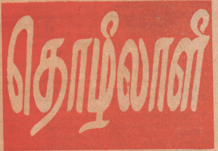
இலங்கை தொழிலாளர் வர்க்கத்தின் வார இதழ் மலர் 6 | இதழ் 5 | டிசம்பர் 1 1967 | பக்கங்கள் 12 | விலை ரூ. 15

இந்த முயற்சியில் அது வெற்றி பெறமா என்பது வேறு விஷயம். இங்கு நாம் இதைப்பற்றிக் கவலைப்படவில்லை, இலங்கையின் ரூபா மதிப்புக் குறைக்கப்பட்டதற்கான காரணங்களை ஆராய்வதுதான் எமது பிரச்சினை. நாம் ஸ்டர்லிங் பிரதேசம்