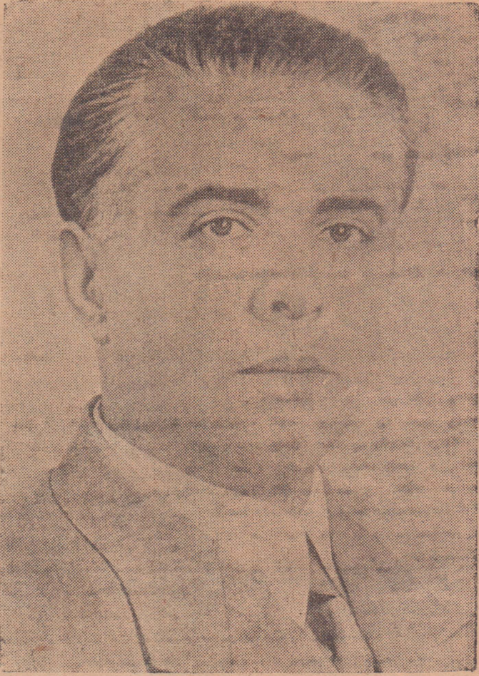
தோழர் அன்வர் ஹோஜா

இன்றைய உலகில் தலைசிறந்த மார்க்சிஸ்ட்-லெனினிஸ்டுகளில் ஒருவரும், அல்பேனியாவின் தலைவருமான தோழர் அன்வர் ஹோஜா அல்பேனியாவின் 20-வது தேசிய தின விழாவின் போது ஆற்றிய உரையை இங்கே வெளியிடுகின்றோம். ஆ -ர்