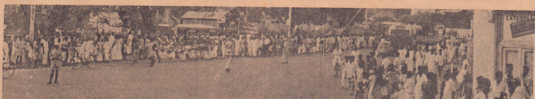
கொழும்பில் புரட்சிகர மே தினம்

இந்த வருட மே தினத்தின் போது தோழர் மா சே-துங்கினது இந்த அறைகூவலை நாம் ஏற்றுக்கொள்வதென சபதமெடுப்போம். வரண்ட பாராளுமன்றப் பாதையை நிராகரிப்போம். தொழிலாளி வர்க்கத்தின் தலைமையில், தொழிலாள-விவசாய ஒற்றுமையின் அடிப்படையில் சகல புரட்சிகர சக்திகளையும் அணிதிரட்டி, ஏகாதிபத்தியத்தையும், நிலப்பிரபுத்துவத்தையும், யு. என். பி. யையும் அதன் பிற்போக்கு சகாக்களையும் தோற்கடிப்பதென சபதமேற்போம்.