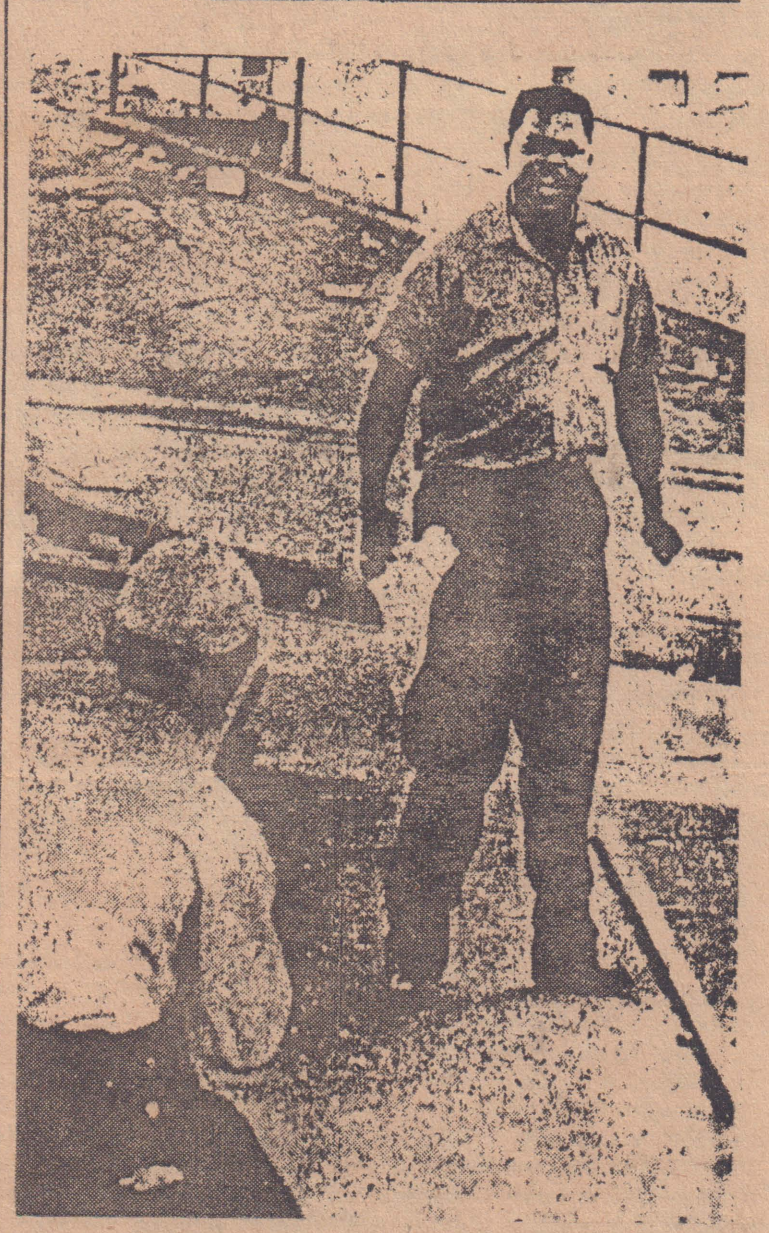
நியூயோர்க் ஹார்லெம்மில் அமெரிக்க ஆளும் வர்க்கத்தின் ஆயுதந் தாக்கிய பொலிஸின் அடக்குமுறைக்கு எதிராக நெருக்குநேர் நின்று போராடும் அமெரிக்க நீக்ரோவரை இப்படத்தில் காண்க.

திரு. ஜெயப்பிரகாஷ் நாராயண பங்குபற்றும் 'சூயாக்கேர்ஸ்' மாநாட்டின் அந்தரங்க நோக்கத்தை அம்பலப்படுத்தக் கூடிய செய்திகள் எங்கும் உள்ளன