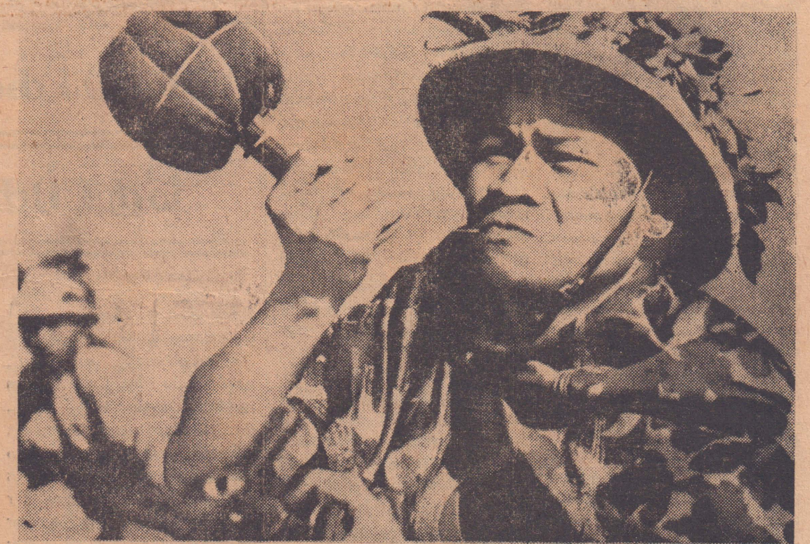
எதிரி மேல் ஆழமான பகைமை கொண்ட வியட்நாம் மக்கள் படையின் போராளி தனது போராட்டத் திறமையை விருத்தி செய்ய பயிற்சி செய்யும் கட்சி.