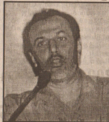
தினங்களாக நடைபெற்ற பன்னிரண்டரை மணித்தியாலப் பேச்சுவார்த்தையின் போது சில பிரச்சினைகள் ஏற்பட்ட போதும் அப் பிரச்சினைகள் மிகவும் ஆழமாகவும், நுணுக்கமாகவும் (10ம் பக்கம் பார்க்க)

இந் நாட்டில் வாழுகின்ற முஸ்லிம் மக்களின் அபிலாசைகளை பூரணமாக நிறைவேற்றக் கூடிய வகையில் தீர்வுத் திட்டம் ஒன்றை தயாரித்து தாய்லாந்தில் இடம்பெறவுள்ள இறுதிக்கட்ட சமாதானப் பேச்சுவார்த்தையின் போது சமர்ப்பிக்கப் போவதாகவும் முஸ்லிம் மக்களின் பிரச்சினைகள் குறித்து வன்னிக்குச் சென்று புலிகளுடன் பேசவுள்ளதாகவும் அமைச்சர் ரவூப் ஹக்கீம் தெரிவித்துள்ளார்.