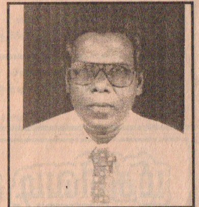
இவர் பத்திரிகைத்துறையில் பணியாற்றி வருபவர் என்பதும் குறிப்பிடத்தக்கது.

மருத்துவப் பட்டதாரியாகிய இவர், கிளிநொச்சி, வேலணைப் பகுதிகளில் பல சமய, சமூக சேவைகளில் ஈடுபட்டு வருவதுடன், வேலணை ஐக்கிய விளையாட்டுக் கழகம், வேலணை கிழக்கு ஐக்கிய உதயமால் சனசமூக நிலையம் ஆகியவற்றின் ஸ்தாபகருமாக விளங்கி வருகிறார்.