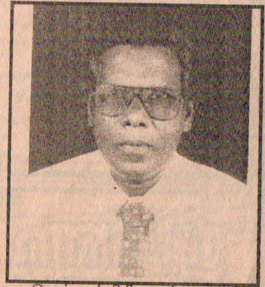
இவர் பத்திரிகைத்துறையில் பணியாற்றி வருபவர் என்பதும் குறிப்பிடத்தக்கது.

மருத்துவப் பட்டதாரியாகிய இவர், கிளிநொச்சி, வேலணைப் பகுதிகளில் பல சமய, சமூக சேவைகளில் ஈடுபட்டு வருவதுடன், வேலணை ஐக்கிய விளையாட்டுக் கழகம், வேலணை கிழக்கு ஐக்கிய உதயமால் சனசமூக நிலையம் ஆகியவற்றின் ஸ்தாபகருமாக விளங்குகிறார்.