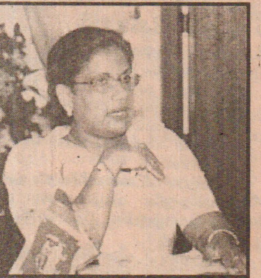
மைக்கு முகம் கொடுக்கும் வகையில், ஸ்ரீலங்கா சுதந்திரக்கட்சியை கட்டியெழுப்ப வேண்டும் என

எழுப்புவதன் மூலமே ஐ.தே.மு. அரசின் ஆட்சியை வீழ்த்த முடியும். இதன் நிமித்தம் கட்சியை பலப்படுத்தும் பொருட்டு, இன்று முதல் வீட்டுக்கு வீடு என்ற செயற்திட்டமொன்றை பிலியந்தலையில் இருந்து ஆரம்பிக்கவுள்ளோம். இதன் மூலம் கட்சியின் ஆதரவாளர்களை ஒன்று திரட்டவும் புதிய உறுப்பினர்களை சேர்த்துக் கொள்ளவும் நடவடிக்கை எடுக்கப்படும் என்றார். 1956ஆம் ஆண்டு எஸ். டபிள்யூ. ஆர். டி. பண்டாரநாயக்க தலைமையில் ஸ்ரீலங்கா சுதந்திரக்கட்சி எவ்வாறு ஆட்சியீட்டம் ஏறியதோ அதே போன்று எதிர்க்காலத்தில் கட்சியின் சிறந்த தலைமைத்துவத்தின் கீழ் புதிய ஆட்சி உருவாக்கப்படுவதை எவராலும் தடுக்க முடியாது என அவர் மேலும் தெரிவித்தார். (தி)