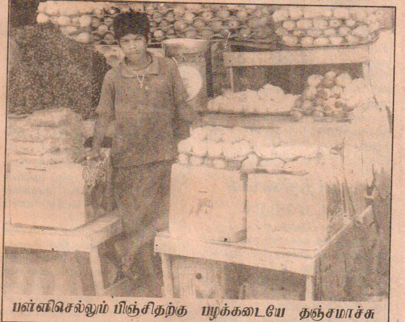
பள்ளிசெல்லும் பிஞ்சிதற்கு பழக்கடையே தஞ்சமாச்சு

இப்படியான சிறார்களை தமது சுய இலாபங்களுக்காக தவறான வழிகளில் பயன்படுத்துகின்ற பண