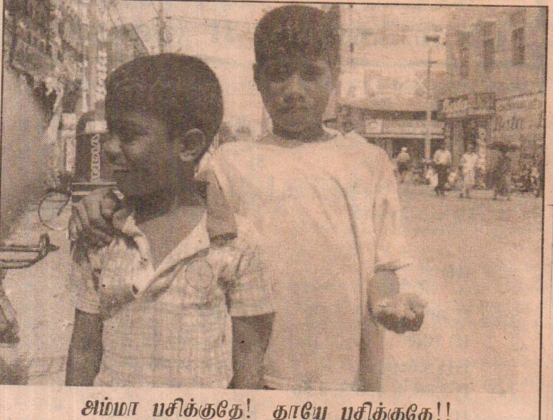
அம்மா பசிக்குதே! தாயே பசிக்குதே!!

என்று ஒலிக்கின்றதோ, அன்று இந்த நிலை மாறும். நான் என்ற அகங்காரத்தை விட்டு, நாம் என்று, என்று சிந்திக்கின்றோமோ அன்று இந்தநிலை மாறும். “யாதும் ஊரே யாவரும் கேளிர்” கனியன் பூங்குன்றனாரின் இந்த வார்த்தையை அர்த்தமுடையதாகுவோம் வாரீர்!