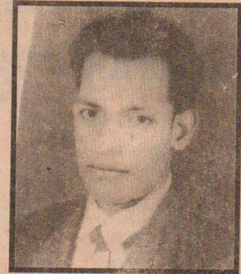
சங்கானை கிழக்கு மத்தி விவசாய சம்மேளனத் தலைவராகப் பணியாற்றிய இவர் தலை சிறந்த சமூக சேவையாளருமாவார்.