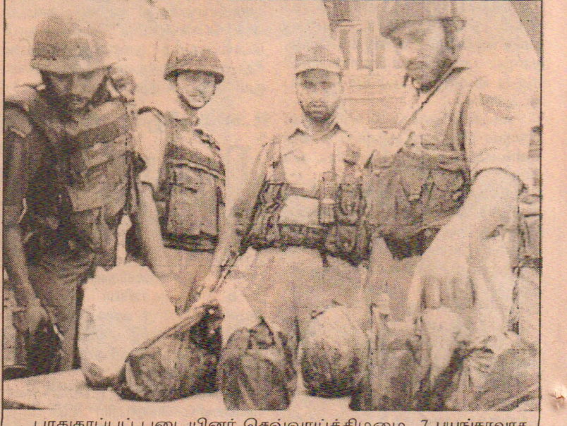
பாதுகாப்புப் படையினர் செவ்வாய்க்கிழமை 7 பயங்கரவாத அமைப்பின் மறைவிடங்களைக் கண்டுபிடித்தனர். அங்கிருந்து ஏராளமான ஆயுதங்கள் மற்றும் வெடிபொருள்களை கைப்பற்றினர்

இதேவேளை, இந்தத்தீர்மானத்திற்கு அமெரிக்கா காட்டி வரும் எதிர்ப்பு அரபாத்தைக் கொலை செய்ய இஸ்ரேலியத் தலைவர்களுக்கு அனுமதி வழங்குவதை எடுத்துக்காட்டுவதாக பலஸ்தீனர்கள் கவலையும், அச்சமும் தெரிவித்துள்ளார்கள். (பி-9)