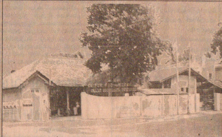
புனரமைக்கப்பட்ட ஜெய்ப்பூர் நிறுவனம்

தோருக்கான செயற்கை அவயவம் பொருத்தல் இயன்மருத்துவம் நவீன தொழில் நுட்பத்துடன் வடிவமைக்கப்பட்ட முச்சக்கர வண்டி, சக்கர நாற்காலி, நடை தாங்கி போன்ற உபகரண உற்பத்தியிலும் கல்வி மாணியம், சயதொழில் முயற்சி, கடன் போன்றவற்றை வழங்கும் ஓர் சேவை நிறுவனமாக இயங்கி வருகின்றது.