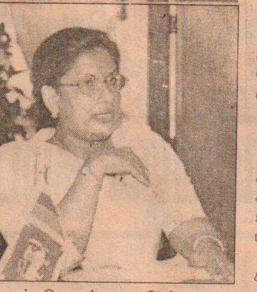
விடயம் தொடர்பான பேச்சுவார்த்தைகளில், பாராளுமன்றத்தில் சகல கட்சிகளினதும் ஆதரவைப்

(கொழும்பு) பொதுஜன ஐக்கிய முன்னணி ஆட்சிக் காலத்தில் சமாதான