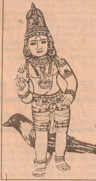
தமிருப்பது சிறப்பானது. மாதச் சனிக்கிழமைகளில் விரதமிருக்கமுடியாதவர்கள் புரட்டாதிமாதச் சனிக்கிழமைகளில் விரதமிருக்கலாம்.

"சனிநீராடு" என்று ஊவையார் கூறியதற்கு ஏற்ப ஒவ்வொரு சனிக்கிழமைகளிலும் எண்ணெய் தேய்த்து நீராடி சனிபகவானை நோக்கி வீர