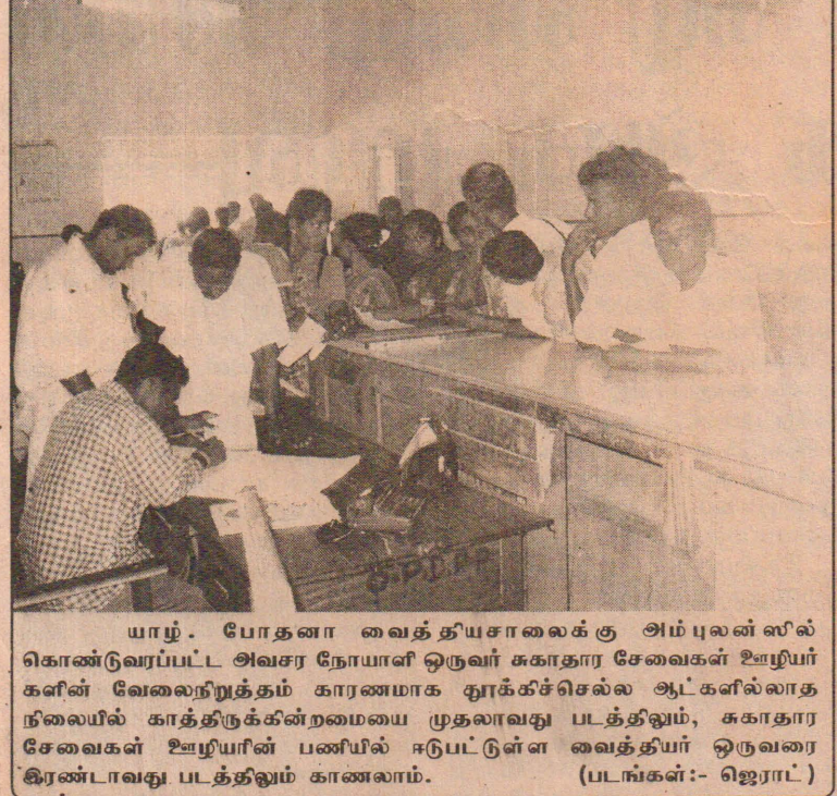
யாழ்ப்பாணம். போதனா வைத்தியசாலைக்கு அம்புலன்ஸில் கொண்டுவரப்பட்ட அனாதை நோயாளி ஒருவர் சுகாதார சேவைகள் ஊழியர்களின் வேலைநிறுத்தம் காரணமாக தூக்கிச்செல்ல ஆட்களில்லாத நிலையில் காத்திருக்கின்றமையை முதலாவது படத்திலும், சுகாதார சேவைகள் ஊழியரின் பணியில் ஈடுபட்டுள்ள வைத்தியர் ஒருவரை இரண்டாவது படத்திலும் காணலாம்.