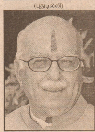
(புதுடில்லி) இந்தியத் துணைப் பிரதமர் எல்.கே.அத்வானி அமெரிக்கா மற்

றும் பிரித்தானியா ஆகிய நாடுகளுக்கு நாளை உத்தியோகபூர்வ விஜயமொன்றை மேற்கொள்ள விருக்கின்றார். இந்த விஜயத்தின்போது, பயங்கரவாதம் குறித்து இருநாட்டுத் தலைவர்களுடனும் கலந்தாலோசனை நடத்தவுள்ளார். அதேசமயம், அமெரிக்காவிற்கு முதலில் பயணம் செய்யும் இவர் அந்நாட்டு ஜனாதிபதி ஜோர்ஜ் டபிள்யூ புஷ், இராஜாங்க அமைச்சர் கொலின்பவல், பாதுகாப்பு அமைச்சர் ரொனால்ட் ரம்ஸ் பீல்ட் மற்றும் தேசிய பாதுகாப்புத் துறை ஆலோசகர் கன்ரல்சாரைஸ் ஆகியோரைச் சந்தித்து தனிப்பட்ட முறையில் பேச்சுக்களையும் நடத்தவுள்ளார். இதனையடுத்து, பிரித்தானியாவிற்கு பயணம் செய்யும் எல்.கே.அத்வானி அந்நாட்டுப் பிரதமர் ரொனி