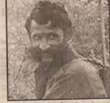
ஒன்றை எடுத்துள்ளார் என்று தகவல்கள் தெரிவிக்கின்றன. (பி-2)