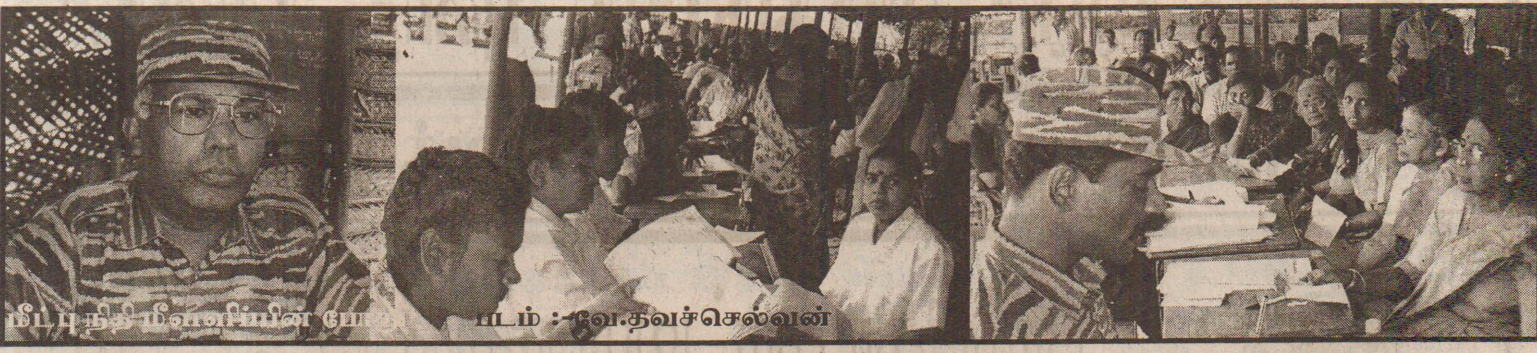
பி.பி.சி. நெல்விபின் போ...