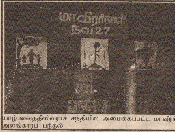
யாழ்.வைத்தல்வராச சந்தியில் அமைக்கப்பட்ட மாவீரர் அலங்காரப் பந்தல்