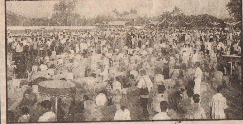
கோப்பாய் மாவீரர் துயிலும் இல்லத்தில் இடம் பெற்ற காட்சிகள்.