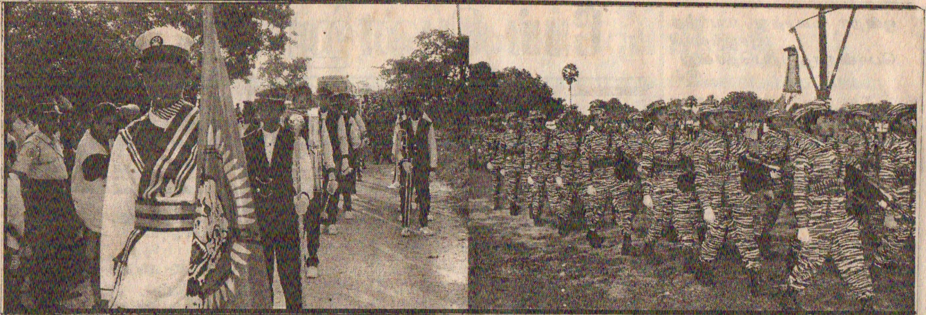
குடாரப்புப் பகுதியில் நேற்று முன்தினம் இடம் பெற்ற கடற் புலிகளின் அணி வகுப்பு.