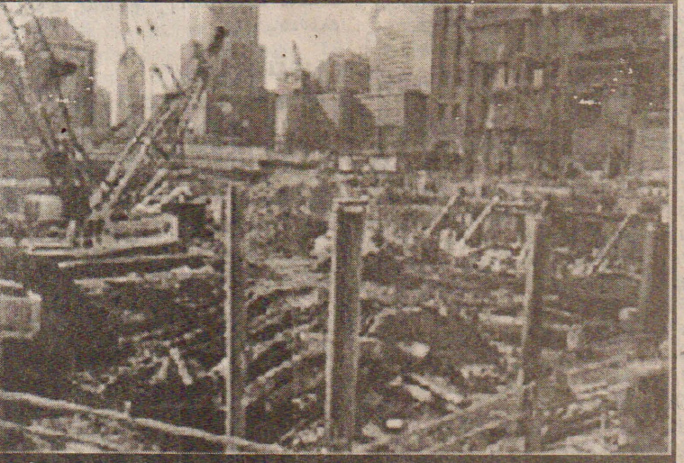
பயங்கரவாதிகளின் தாக்குதலைத் தரமடமாக்கப்பட்ட நியூயார்க் உலக வர்த்தக மைய வளாகத்தில் புதிய மாளிகை ஒன்று கட்டப்பட உள்ளது. 9970டி உயரமும், 52 மாடிகளைக் கொண்டும் இந்த மாளிகை அமையும். வரும் 2005ஆம் ஆண்டிற்குள் இதனைக் கட்டிமுடிக்கத் திட்டமிடப்பட்டுள்ளது.

இந்தக் கூட்டத்தில் கலந்து கொள்ளவிருந்த தமிழக முதலமைச்சர் ஜெயலலிதாவுக்கு உடல்நலப்பிணை காரணத்தினால் கலந்து கொள்ளவில்லையென்றும், இவருடன் கேரள முதலமைச்சர் ஏ.கே. அண்ண தவிர்க்க முடியாத காரணத்தினால் கலந்து கொள்ள முடியவில்லை யென்பதாலும் கூட்டம் ஒத்திவைக்கப்பட்டுள்ளது என்று சென்னை மாநில அரசு செய்திகள் தெரிவிக்கின்றன. இதேவேளை இந்தக் கூட்டம் எதிர்வரும் டிசம்பர் மாத இறுதி வாரத்தில் அல்லது ஜனவரிமாத முதல் வாரத்தில் நடைபெறும் என்று மத்திய நீர்வளத்துறை அமைச்சர் அர்யுன் சரத்ஷெத்தி அறிவித்துள்ளார். (பி-2)