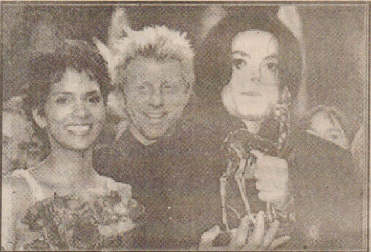
பாப் இசை உலகில் முன்னணியில் உள்ள மைக்கேல் ஜாக்சனுக்கு, ஜெர்மனியின் பெர்லின் நகரில் நடைபெற்ற விருது வழங்கும் நிகழ்ச்சியில் 'மிலேனியத்தில் சிறந்த பாடகர்' விருது வழங்கப்பட்டது. உடன் இருப்பவர் ஹொலிவுட் நடிகை ஹேலி பெயர்.

அமெரிக்கா ஏற்கனவே கோடிக்கணக்கான பெரியம்மை நோய்த்தடுப்பு மருந்துகளை கொள்வனவு செய்வதற்கான ஒழுங்குகளை மேற்கொண்டுள்ளது. (பி-4)