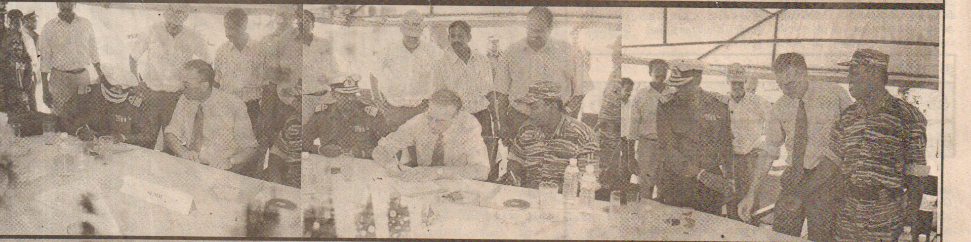
கடல் வலய நடை முறைகள் குறித்த ஒப்பந்தத்தில் முத்தரபினரும் கைச்சாத்து