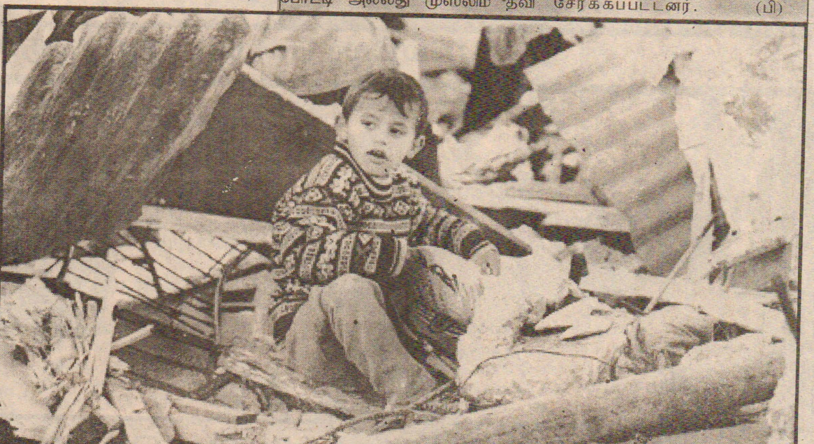
இஸ்ரேலியத் துருப்பினரால் அழித்தொழிக்கப்பட்ட வீட்டின் சீதைவுகளுக்குள் பிள்குப் பாலகன்.