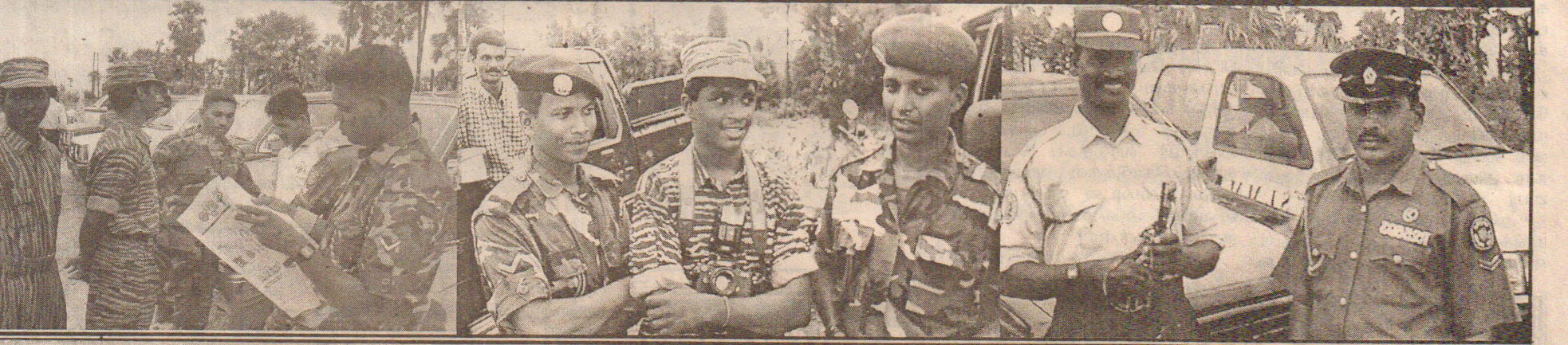
பகை மறந்த பரவசத்தில்.....