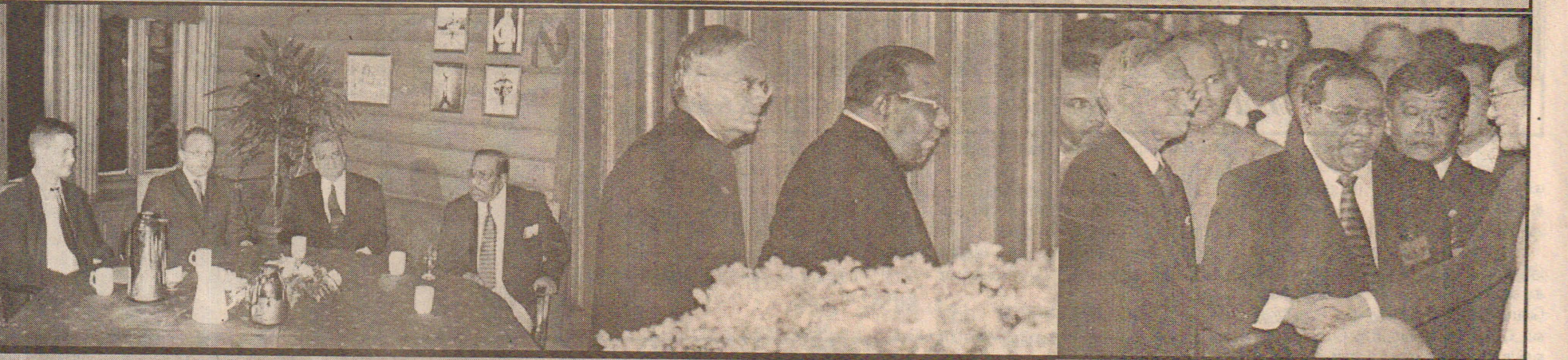
ஒஸ்லோ மாநாட்டில் ஒருமித்த குரல்