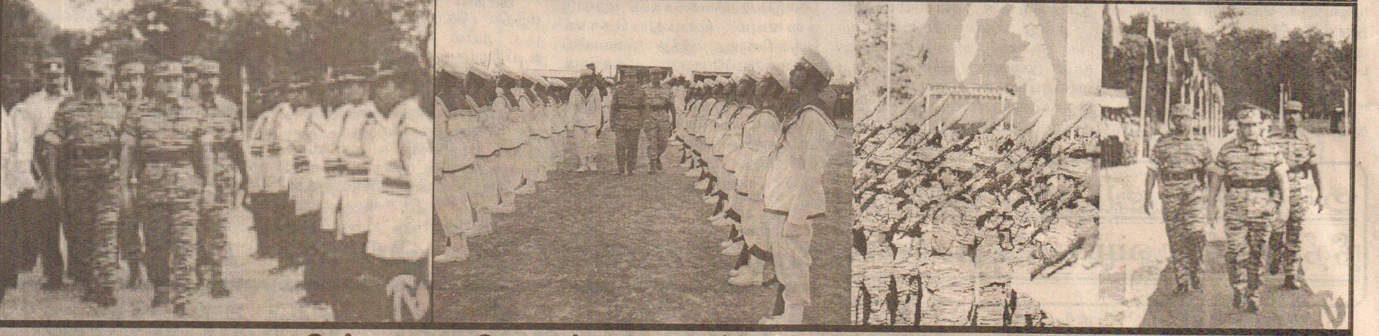
படைகளின் அணிவகுப்பை ஏற்கும் தலைவர் பிரபாகரன்