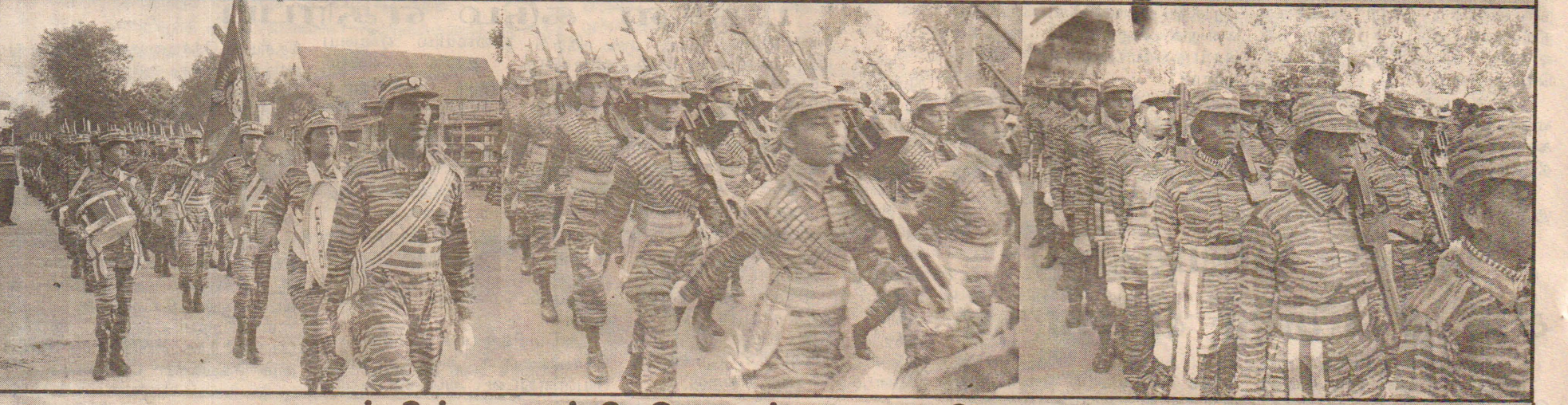
நடத்தில் எழுச்சி கொண்ட மகளிர் படையணி