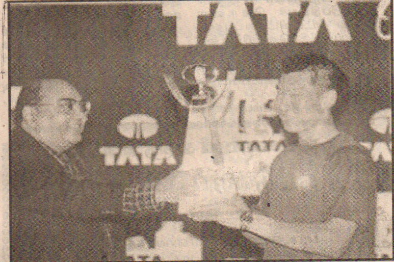
TATA ஓபன் எடிபி டென்ஸில் சாம்பியன் பட்டத்தைத் தாய்லாந்து வீரர் பாரடான் ஸ்ரீ சாப்பான், ஸ்லோவாகியா வீரர்களால் குசேராவை 6-3, 6-1 என்ற நேர் செட்டில் தோற்கடித்துச் சாம்பியன் பட்டத்தை வென்றார்.

பாகிஸ்தானுக்கு 400வாகனங்கள் அல்கெய்டா இயக்க உறுப்பினர்களைக் கண்டு பிடிக்கும் முயற்சிக்கென 13மில்லியன் பெறுமதியான 400 வாகனங்களை அமெரிக்கா பாகிஸ்தானுக்கு வழங்கியுள்ளது. மேலும் 73மில்லியன் டொலர் பெறுமதியான இராணுவ உதவிகளை வழங்க அமெரிக்கா உத்தேசித்துள்ளது.