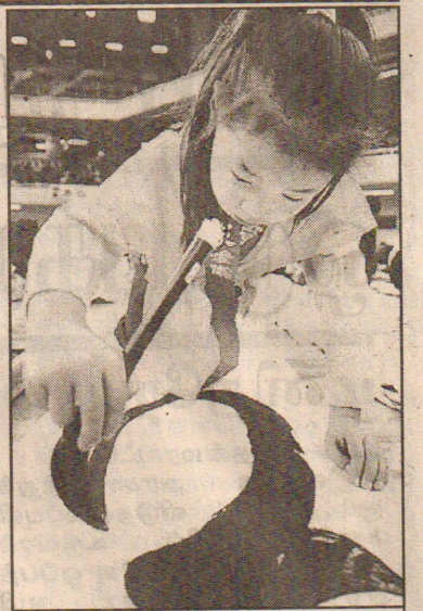
டோக்கியோ நகரில் புத்தாண்டையொட்டி நடந்த அலங்கார எழுத்துப் போட்டியில் ஜப்பான் சிறுமியின் வர்ண ஜாலத்தினைப் படத்தில் காண்கிறீர்கள்.

பலஸ்தீனத்தில் எங்கள் மக்களை இஸ்ரேல் கொன்று குவிக்கிறது. இதிலிருந்து உலக கவனத்தைத் திசை திருப்பவே அமெரிக்கா முயலுகிறது. ஐக்கிய நாடுகளின் தீர்மானத்தையும் மீறி செயல்படுமாறு ஆயுதச் சோதனை அதிகாரிகளை அமெரிக்கா நிர்ப்பந்திக்கிறது. ஈராக் விஞ்ஞானிகளிடம் கடுமையாக நடந்து கொள்ளுமாறு அது தூண்டுகிறது. நாம் எதிரியால் தவறான முறையில் கணிக்கப்பட்டு நடத்தப்பட்டு வருகிறோம். நமது நேர்மையை அவர்கள் சந்தேகிக்கிறார்கள். எனவே உண்மையான நல்ல மக்களைக் கொண்ட நாடுகள் நம்மை ஆதரிப்பதோடு நம்முடன் ஒத்துழைப்பார்கள். நாம் எல்லாம்வல்ல இறைவனை நம்பி சார்ந்திருக்கிறோம். அவர்கள் சாத்தானையும் இருட்டையும் நம்பியுள்ளார்கள். எனவே நமக்கு ஒவ்வொரு நாளும் நல்ல நாளா