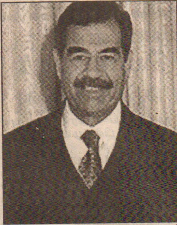
கவே விடியும். நமது அம்புகள் குறி தவறாது. ஆனால் எதிரியின் அம்புகள் வீணாகும். (பி)

இஸ்லாமிய சகோதரத்துவ இயக்கத்தைச் சேர்ந்த 14 உறுப்பினர்களை எகிப்திய பாதுகாப்புப்பிரிவினர் கைதுசெய்துள்ளனர். செப்டம்பர் மாதம் அமெரிக்கத் தாக்குதல் நடைபெற்ற பின்னர் இந்த இயக்கம் தொடர்பாக எகிப்து கடுமையாக நடந்து வருகிறது.