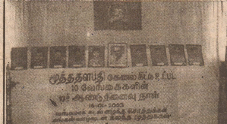
கேணல் கிட்டுவின் நினைவு தினம் உணர்வு பூர்வமாக அனுஷ்டிப்பு

(யாழ்ப்பாணம்) தமிழ் விடுதலைப் புலிகளின் மூத்த தளபதி கேணல் கிட்டு உட்பட, வங்கக் கடலில் காவியமான பத்தப் போராளிகளினதும் 10ம் ஆண்டு நினைவு நாள், நேற்று வடக்கு கிழக்குத் தமிழர் தாயகப்பிரதேசமெங்கும் உணர்வு பூர்வமாக அனுஷ்டிக்கப்பட்டது.