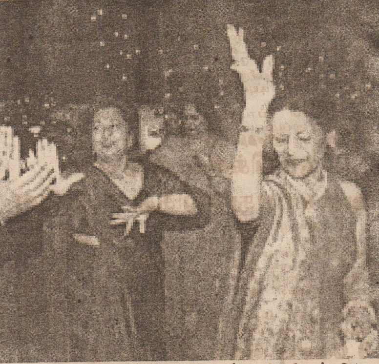
குளிக்காலம் விடைபெறுவதையொட்டி பஞ்சாயில் லோகிரீ என்ற திருவிழாக் கொண்டுள்ள போது அந் நகர மக்கள் மகிழ்ச்சியில் ஆடிப்பாடுவதைக் காணலாம்.

இந்த அமைச்சரவை மாற்றத்தின் போது வெளியுறவு அமைச்சர் யத்வதிசிங்ஹா உட்படப் பலரின் அமைச்சர் பதவிகளில் மாற்றம் செய்யப்படலாமென மத்திய அமைச்சின் சிரேஷ்ட அமைச்சர் ஒருவரை மேற்கோள் காட்டி இந்திய பத்திரிகையொன்று செய்தி வெளியிட்டிருக்கிறது. (பி-2)