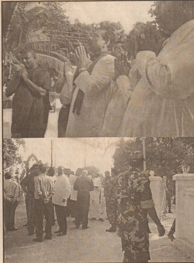
நேற்று முன்தினம் யாழ்ப்பாணம் வந்த எதிர்க்கட்சித் தலைவர் மகிந்த ராஜபக்ஷ, மற்றும் அவருடன் வந்த எதிர்க்கட்சிப் பாராளுமன்ற உறுப்பினர்கள் நயினாதல் நாகவிகாரைக்கு விஜயம் செய்த போது எடுக்கப்பட்ட படங்கள்.

இதன் பிரகாரம் 1997ஆம் ஆண்டு ஆகஸ்ட் மாதம் முதலாம் திகதி தொடக்கம் இணைந்த சேவையில் உள்ளீர்க்கப்படுவதற்கு தகைமை பெற்றுள்ள சகல நூலகங்களும் தமது விண்ணப்பப்படிவங்களை எதிர்வரும் பெப்ரவரி மாதம் 28ஆம் திகதிக்கு முன்னர் இணைந்த சேவைகள் பணிப்பாளர் நாயகத்துக்கு அனுப்பி வைக்குமாறு அரசாங்க நிர்வாக முகாமைத்துவ ஸ்திரீயப்படி அலுவலர் செயலாளர் அறிவித்துள்ளார். (உ-8)