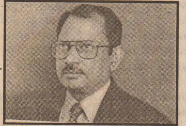
நிரந்தர சமாதானம் ஏற்படவேண்டும் என்பதில் உறுதியாகவுள்ளார்.

அதற்கு வழி காட்டியாகவும் உள்ளனர் என்பதை இந்நிகழ்வின் போது உரையாற்றிய சர்வதேச இந்துமத குருமார் ஒன்றியத்தினரின் பேச்சுக்கள் எடுத்துக் காட்டுகின்றன.