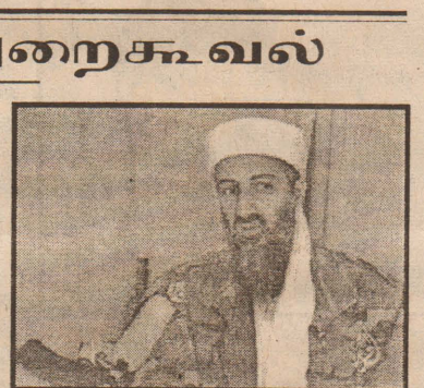
அம்புகளை எய்துவரும் முஸ்லிம்கள் எப்போது தமது எதிரிகளை நோக்கி அம்பெய்யப்போகிறார்களெனவும் கேள்வியெழுப்பியுள்ளார். (உ-2)

பின்லேடனின் கையொப்பம் இடப்பட்டிருந்த இந்த அறிக்கையில் முஸ்லிம்கள் எப்போது விழித்தெழும் போகிறார்கள்? என்றும் நண்பர்களையும் எதிரிகளையும் எவ்வாறு இனங்காணப் போகின்றார்களெனவும் கேள்வி எழுப்பப்பட்டுள்ளது.