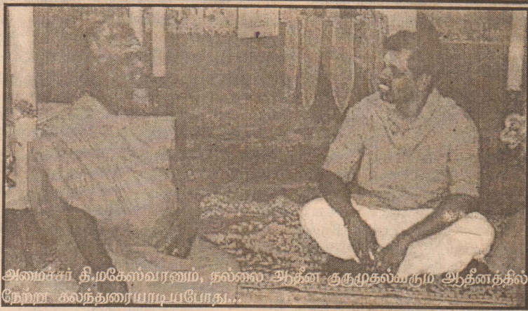
அமைச்சர் தி.மகேஸ்வரனும், நல்லை ஆதீன குழுமுகல்வாரும் ஆதீனத்தில் நேற்று கலந்துகொண்டபோது...

பிரச்சினையைக் கூறினேன் கடந்த திங்கட்கிழமை ஐனாதிபதி மாளிகையில் நடைபெற்ற பொங்கல் விழாவில் கலந்து கொண்ட போது தமிழ் மக்களின் பிரச்சினைகளான அதிஉயர் பாதுகாப்பு, வலய மீள் குடியேற்றம், இராணுவக் கெடுபிடிகள், சிறைகளில் தடுத்துவைக்கப்பட்டுள்ள தமிழ் அரசியல் கைதிகள் விடுதலை, கைதிகளுக்கான பொதுமன்னிப்பு (10ம்பக்கம் பார்க்க)