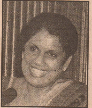
சமாதானம் மலரும் என நம்பிக்கை வெளியிட்டுள்ளார். (உ-8)

அதில் சில மாற்றங்கள் கொண்டுவரப்பட்டு, அதனை வழிநடத்துவதினால் நாட்டில் நிரந்தர