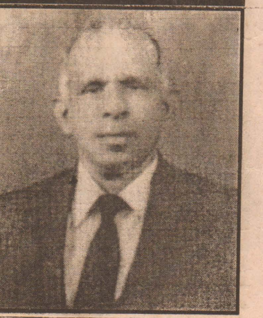
(இந்தக் குறிப்புக்களை எப்பொழுதுமே தமது வாகனங்களில் வைத்துக் கொள்ளும்படி வாகன ஓட்டிகளை திரு பேரின்பநாயகம் கேட்டுள்ளார்.) (பி)

4. பாதிக்கப்பட்டவருக்கு காப்புறுதி நிறுவனத்தினால் வழங்கப்படவேண்டிய தொகையை நிர்ணயிக்க முடியாமல் போகும்.