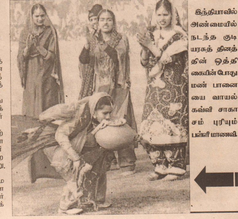
இந்தியாவில் அண்மையில் நடந்த குடியரசுத் தினத்தின் ஒத்திசைப்போது மண் பாணையை வாயல் கவ்வி சாகாசம் புரியும் பள்ளி மாணவி

போல் வேட்டிட்டுக்கொண்டு உளவுத் துறை அதிகாரிகள் பரிசோதனைகளின் முன் பேட்டியளிக்கத் தோன்றுவதாகவும் தகவல் கிடைத்திருப்பதாக அவர் கூறினார். ஆறு விஞ்ஞானிகள் ஏற்கனவே ஆயுதப்பரிசோதகர்கள் முன் கருத்துக் கூறுவதற்கு முன்வர மறுத்துள்ளார்கள் என்றும் உண்மைகளைக் கூறினால் ஏற்படக் கூடிய எதிர்விளைவுகளை உத்தேசித்தே இவர்கள் இரகசியமாக சாட்சியம் கூற முன் வருகிறார்கள் என்று கூறப்படுகின்றது. ஈராக்கிய அதிகாரிகளின் பிரச்சனையில் லாமலே விஞ்ஞானிகளை விசாரிப்பதற்கு ஆயுதப் பரிசோதகர்களுக்கு அதிகாரம் இருப்பதாகக் கூறப்படுகின்றது. (பி)