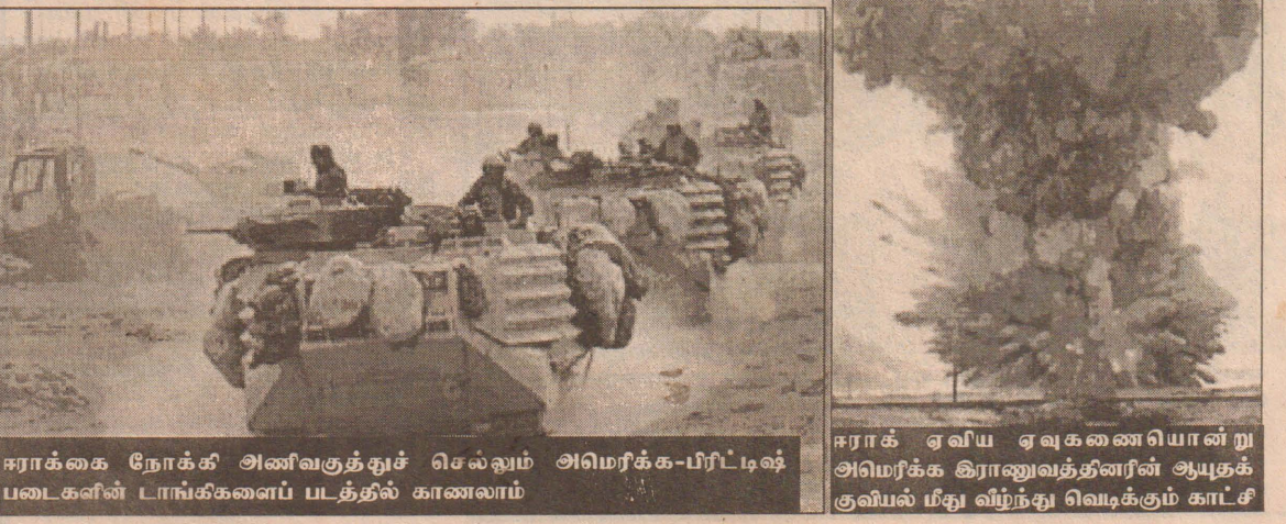
ஈராக் கை நோக்கி அணிவகுத்துச் செல்லும் அமெரிக்க-பிரிட்டிஷ் படைகளின் டாங்கிகளைப் படத்தில் காணலாம்

குறிப்பிட்டார். ஈராக்கில் அவர்களுக்கு எந்தவித எதிர்காலமும் இல்லை என்பதாலும் சட்ட விரோத குற்றச் செயல்களில் ஈடுபட்டதாலும் அவர்களை பிடித்து வைத்திருப்பதாக இராணுவ அதிகாரியை மேற்கோள் காட்டி பி.பி.ஸி செய்தி தெரிவித்தது. தற்போது தாக்குதலின் அடுத்த கட்டத்திற்கு தயாராகி வருவதாக பிரிட்டன் வெளியுறவுத் துறை ஜூனியர் அமைச்சர் கருத்து தெரிவித்துள்ளார். தாங்கள் என்ன செய்ய வேண்டும் என்பதில் தெளிவாக செறுகொண்டிருப்பதாகவும், போர் குறித்த திட்டத்தை வகுத்து அதனுட்படையில் முன்னேறி வருவதாகவும் அவர் மேலும் கூறினார். (பி)