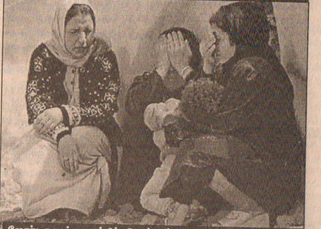
ஜோர்டானுக்கு தப்பிச் சென்றுள்ள ஈராக்கிய அகதிகள்