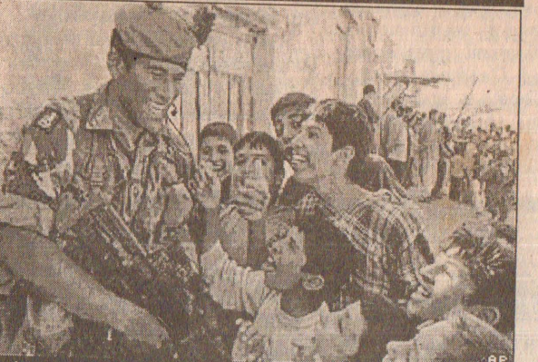
தென் ஈராக்கில் அல் சுயிர் என்ற இடத்தில் பிரிட்டிஷ் வீரர் ஒருவரை சூழ்ந்து நிற்கிறார்கள் அப்பகுதி சிறுவர்கள்