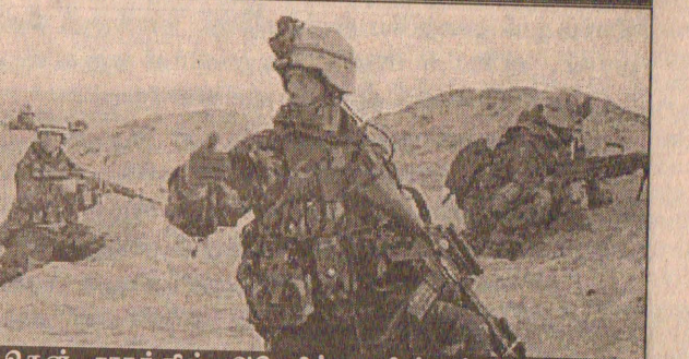
தென் ஈராக்கில் அமெரிக்க வீரர்கள் மலைகள், ஓடைகளைக் கடந்து போர் நடவடிக்கைகளில் ஈடுபட்டுள்ளனர்.