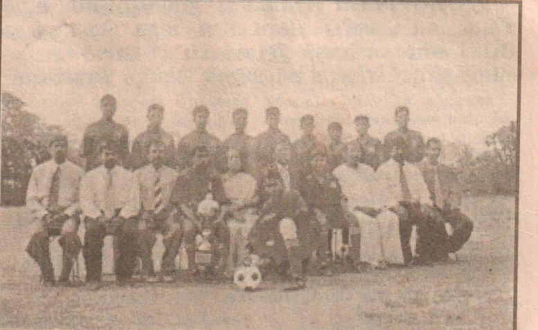
யாழ். மாவட்டப் பாடசாலைகளுக்கிடையிலான உதைபந்தாட்டப் போட்டியில் சம்பியனாகத் தெரிவு செய்யப்பட்ட யா/ஸ்கந்தவரோதயக் கல்லூரி அணியினர் வெற்றிக் கேடயத்துடன் காட்சியளிக்கின்றனர்.