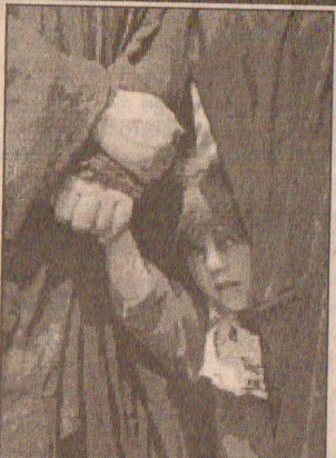
பக்தாத்திற்கு 80 கி.மீ. தூரத்தில் ஹில்லா என்ற இடத்தில் குண்டு வீச்சில் காயமுற்ற இரு சிறுவர்கள் சிகிச்சைக்காக காத்திருக்கின்றனர்.