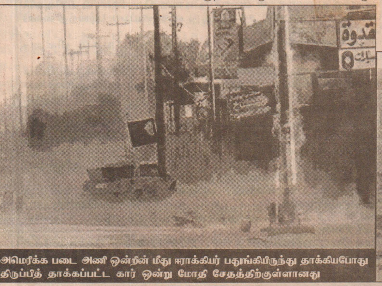
அமெரிக்க படை அணி ஒன்றின் மீது ஈராக் கியர் பதுங்கியிருந்து தாக்கியபோது திருப்பித் தாக்கப்பட்ட கார் ஒன்று மோதி சேதத்திற்குள்ளானது

பக்தாத் நகர வீதிகளில் சண்டை செய்வதை கூட்டுப்படைவீரர் விரும்பவில்லை. பொதுமக்களுக்கு பாதிப்புக்கள் அதிகம் ஏற்படலாம் என்று கருதப்படுகின்றது. (பி)