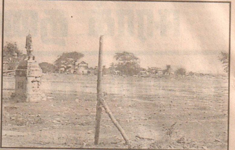
யாழ்ப்பாணத்தின் கேந்திர முக்கியத்துவம் வாய்ந்த யாழ். மாநகரசபை வளாகம் மற்றும் கோட்டைச் சுற்றாடல் பகுதிகளில் படையினரின் முகாம் அமைக்கும் பணி இடைநிறுத்தப்பட்ட பின்...

இளம் வீரர் ஒருவரை உப தலைவராக நியமிக்க நாம் முடிவு செய்துள்ளோம் பங்களாதேஷ் சுற்றுப்பயணத்தின் போது புதிய உப தலைவரை நாம் அறிவிப்போம் இளம் வீரர்களின் கூட்டாக உருவாகும் தென்னாபிரிக்க அணியையே நாம் எதிர் பார்க்கின்றோம் என்றார். (உ-55)