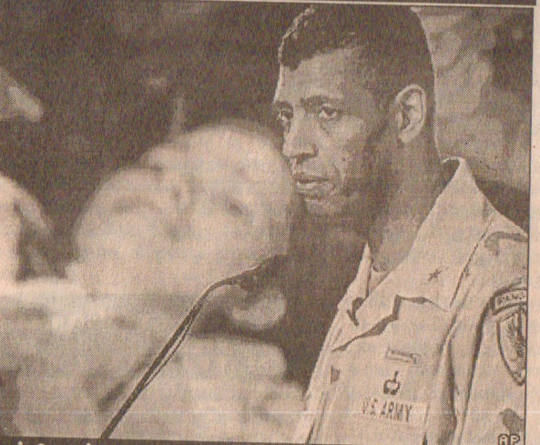
ஈராக்கியரால் கைது செய்யப்பட்டு விடுதலை செய்யப்பட்ட பிரிட்டிஷ் படை வீரர்களை யுடன் பிரிகேடியர் ஜெனரல் வீன்சென்ட் புகுக்கல்