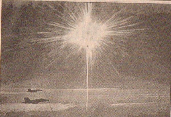
வட ஈராக்கில் இரு விமானங்கள் குண்டு வீச்சுக்கு ஈடுபட்டு செல்கின்றன.

ஈராக்கின் மேற்குப் பகுதியில் இஸ்ரேலிலிருந்து தாக்கக் கூடிய தொலைவில் ஸ்கட் ரக ஏவுகணைகள் இருப்பதற்கான உறுதியான