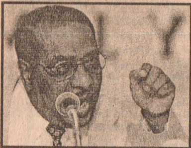
முதாரில் இளைஞர் கூட்டுக் கொலை

(லண்டன்) சமாதானப் புரிந்துணர்வு ஒப்பந்தத்தை அரசு சரியான முறையில் நடைமுறைப்படுத்தத் தவறியமைக்கு ஆழமான அதிருப்தியை வெளிப்படுத்தும் முகமாக சமாதானப் பேச்சுக்களில் கலந்து கொள்வதை விடுதலைப்புலிகள் இடைநிறுத்தியுள்ளதாக சமாதானப் பேச்சுவார்த்தைக்கு தலைமை தாங்கும் விடுதலைப்புலிகளின் அரசியல் ஆலோசகர் கலாநிதி அன்ரன் பாலசிங்கம் பிரதமர் ரணில் விக்கிரமசிங்காவிடம் கடிதம் மூலம் அறிவித்துள்ளார்.