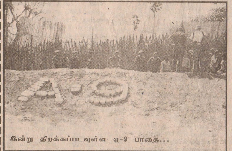
இன்று திறக்கப்படவுள்ள ஏ-9 பாதை...

இப் பாதை திறப்பதற்கு வசதியாக முகமாலையில் முன்று கொட்டில்கள் சீமெந்திட்டுப் பூர்த்தியாக்கப்பட்டுள்ளதாகவும் மற்றும் மலசல கூட வசதிகள் குடிதண்ணீர் வசதிகளும் செய்யப்பட்டுள்ளதாகவும் யாழ் செயலக (10ம் பக்கம் பார்க்க)