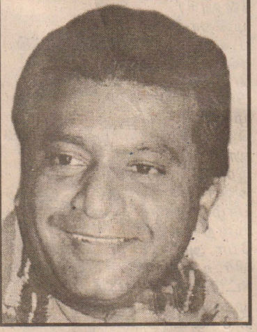
குழுவினர் விமானப் படைக் குச் சொந்தமான ஹெலிகாப்டரில் கிளிநொச்சி மத்திய மகாவித்தியாலயத்தில் வந்திறங்கினார். (8ம் பக்கம் பார்க்க)