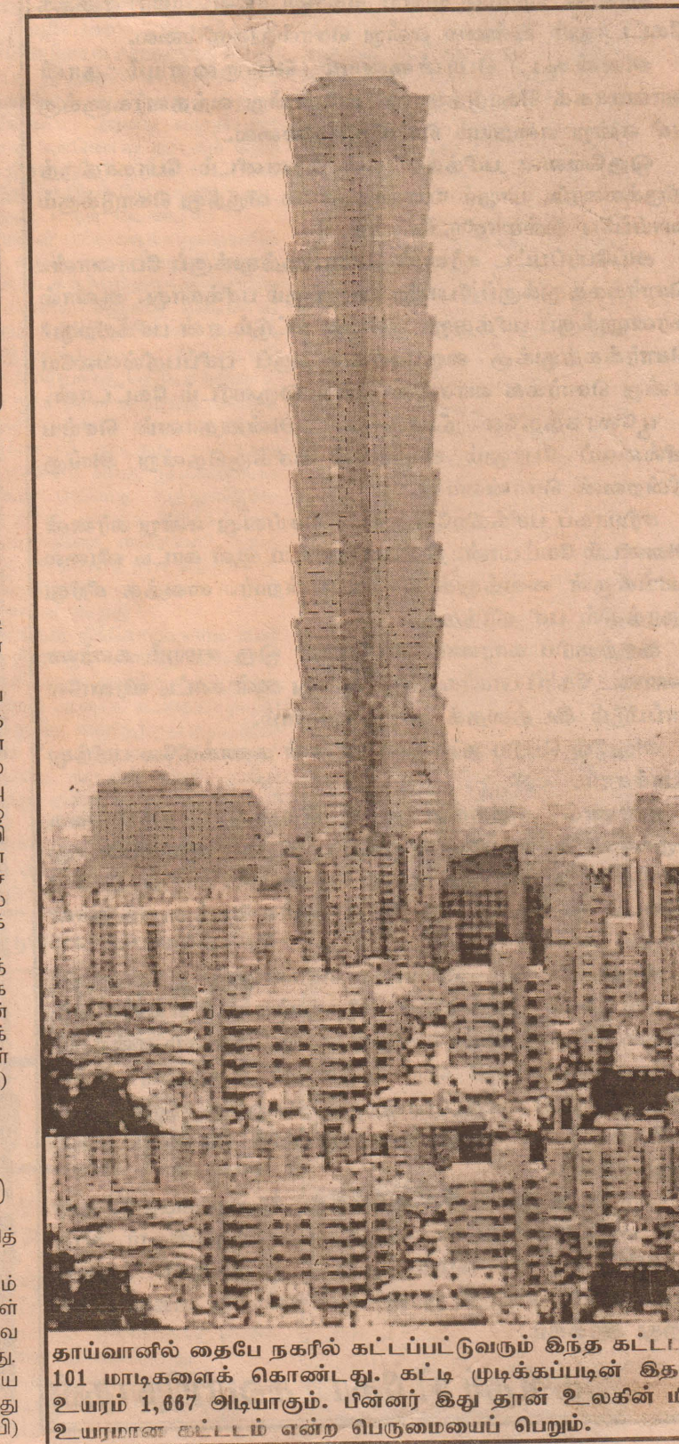
தாய்வானில் தைபே நகரில் கட்டப்பட்டுவரும் இந்த கட்டடம் 101 மாடிகளைக் கொண்டது. கட்டி முடிக்கப்படும் இதன் உயரம் 1,667 அடியாகும். பின்னர் இது தான் உலகின் மிக உயரமான கட்டடம் என்ற பெருமையை பெறும்.

வேலைநிறுத்தத்தில் இறங்கும் அரச ஊழியர் மீது அவசர பணிகள் சட்டத்தின் கீழ் தமிழக அரசு நடவடிக்கை எடுக்கத் தொடங்கியிருக்கிறது. தொழிற்சங்கங்களின் முக்கிய தலைவர்கள் அனைவரும் கைது செய்யப்பட்டு வருகின்றனர். (பி)