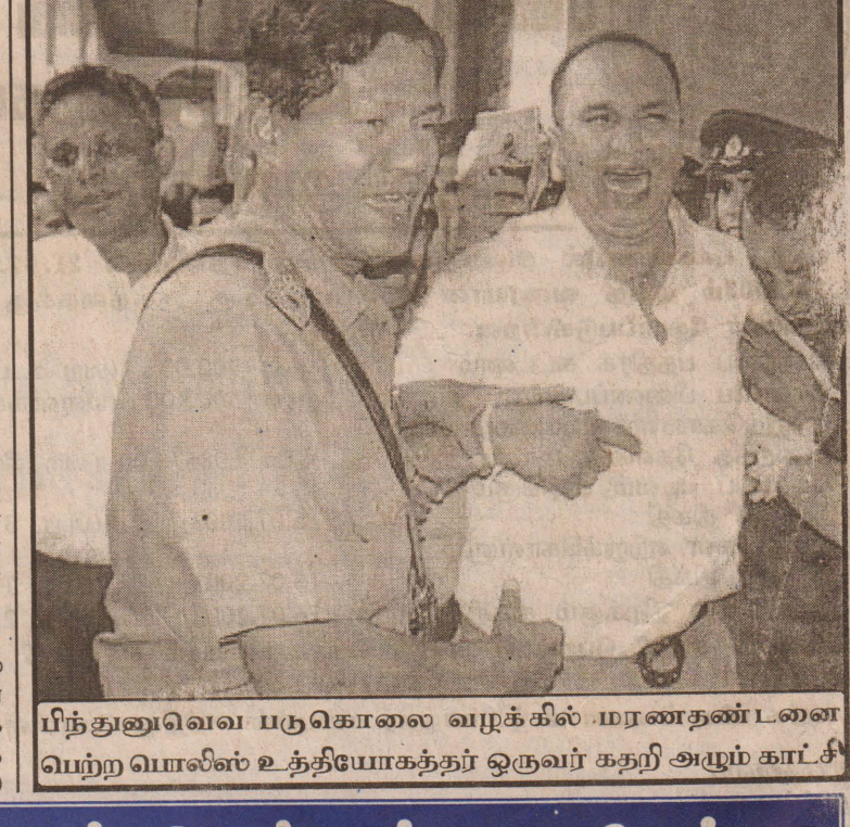
பிந்துனுவெவ பருகொலை வழக்கில் மரணதண்டனை பெற்ற வாலிஸ் உத்தியோகத்தர் ஒருவர் கதறி அழும் காட்சி