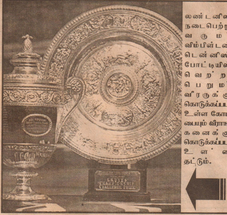
லண்டனில் நடைபெற்று வரும் விம்பிள்டன் டென்னிஸ் போட்டியில் பெற்றும் வீரருக்கு கொடுக்கப்பட உள்ள கோபயையும் வீராங்கனைக்கு கொடுக்கப்பட உள்ள தட்டும்.

ஈராக்க் தூதர் விடாப்பிடி (பீக்கிங்) சீனாவிலுள்ள ஈராக்கியத் தூதுவரை நாடு திருப்பியனுப்பும்படி அமெரிக்கா தலைமையிலான நிரவாகத்தினர் கோரிக்கை விடுத்துள்ள போதிலும், தான் ஈராக்க செல்லப்போவதில்லை என்று அந்தத் தூதுவர் திட்டவாட்டமாக அறிவித்துள்ளார். இதனைத் தொடர்ந்து பீக்கிங்கில் உள்ள ஈராக்கியத் தூதரகத்தின் பாதுகாப்புப் பஸ்படுத்தப்பட்டுள்ளது. (உ-9)