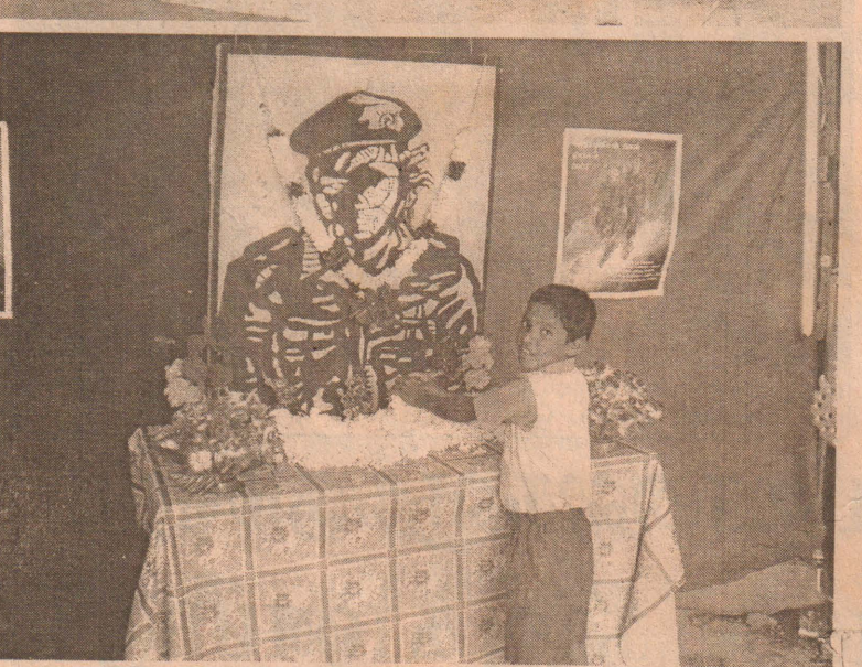
நெல்லியடியில் நடைபெற்ற கரும்புலிகள் நினைவு நாள் எழுச்சி நிகழ்வின் சில காட்சிகள்