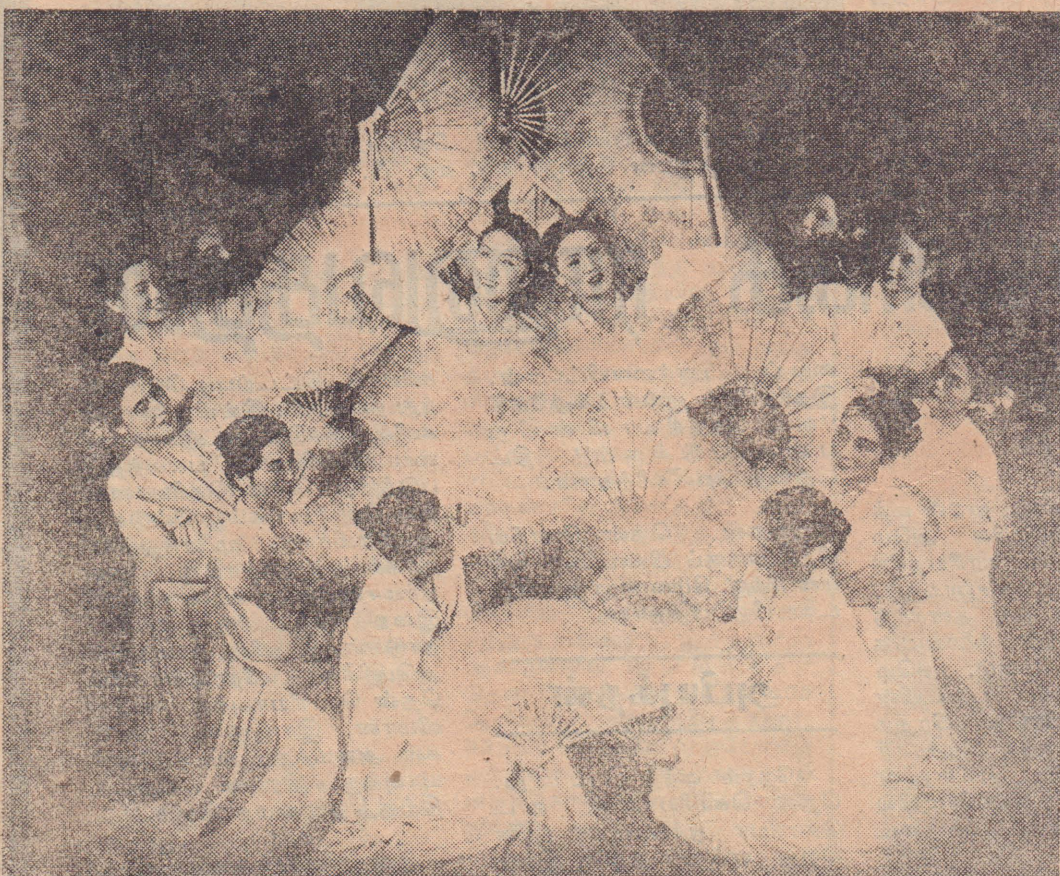
கொரியாவின் பாரம்பரிய நடனக் கலை. அமெரிக்க காலனி ஆட்சியின் கீழ் தென் கொரியாவில் அருகி அழிந்துவிட்ட அரங்கு கலைகள் வட கொரியாவில் மட்டும் செழித்து வளர்கின்றன.

சிங்மன் ரீயின் கதி பாக்கையும் அணுகிவிட்டது. புதிய அடிவருடியைப் பதவியிலிட்டு நிலைமையைச் சமாளிக்க அமெரிக்க ஏகாதிபத்தியம் முயலலாம். ஆனால், எத்தனை ரீகையும் பாக்குகளையும் மாற்றினாலும் அமெரிக்க ஆட்சி கொரியாவில் நிலைக்க முடியாது. மக்கள் போராட்டம் மீண்டும் வெடிப்பது உறுதி. கொரியாவில் அமெரிக்க காலனி ஆட்சியின் இறுதி அண்மிவிட்டது.