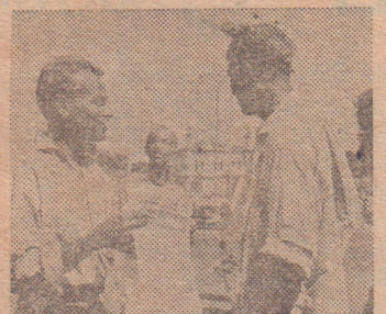
சாலமுல்லை கட்சித் தோழர்கள் ஏற்கெனவே பத்திரிகை வளர்ச்சி இயக்கத்தில் ஈடுபட்டுவிட்டனர். சாலமுல்லை கட்சிக் கிளை செயலாளர் இங்கு பத்திரிகை விற்கிறார்.