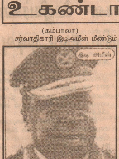
சர்வாதிகாரி இடி அமீன் மீண்டும் உயிருடன் உகண்டாவிற்கு வந்தால் அவர் கைது செய்யப்படுவார் என்று உகண்டா ஜனாதிபதி ஜவேனி முஷேபினி தெரிவித்துள்ளார்.

(கம்பாலா) சர்வாதிகாரி இடி அமீன் மீண்டும் அதேசமயம், இடி அமீன் இறந்தால் அவரது உடலை உகண்டாவிற்கு எடுத்து வந்து இறுதிக்கிரியைகள் செய்ய அனுமதிக்கப்படும் என உகண்டாவின் நியூவிஷன் பத்திரிகைக்கு வழங்கிய பேட்டி யொன்றில் முஷேபினி கூறியுள்ளார். 1971ஆம் ஆண்டு முதல் 79ஆம் ஆண்டுவரை உகண்டாவில் ஆட்சி செய்த இடி அமீன் தன்னுடைய ஆட்சிக்காலத்தில் சுமார் 3 லட்சம் பேரைக் கொன்று குவித்துள்ளார் என்று இவர் மீதான குற்றச் சாட்டுக்களில் தெரிவிக்கப்படுகின்றது. 1979ல் தன்சானியப் படைகள் நடத்திய தாக்குதலையடுத்து இடி அமீன் உகண்டாவை விட்டுத் தப்பியோடினார். அதன் பின்னர் சிறிது காலம் லிபியாவில் வசித்து வந்த அமீன், பின்னர் நீண்ட