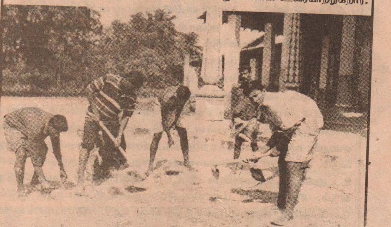
இந்து இளைஞர் மன்றத்தால் சமய தொண்டு நகழ்வாக வியாபாரி முல்லை இன்பர்சிடி சீத்த வீரநாயகர் ஆலயத்தில் இடம்பெற்ற சீர்தானத்தின் போது