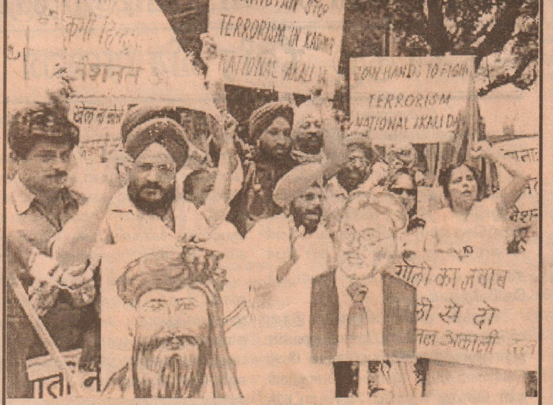
பாகிஸ்தான் ஆதரவு பயங்கரவாத இயக்கங்களினால் இந்தியாவில் நடத்தப்பட்டுவரும் பயங்கரவாத செயல்களுக்கு கண்டனம் தெரிவித்து அகால்தள தொண்டர்கள் பாராளுமன்ற வளாகத்தின் அருகே நன்று ஆர்ப்பாட்டம் நடத்தினர். அதில் பாகிஸ்தான் அதிபர் முஷாரப் பிற்கு எதிராக கோஷங்கள் எழுப்பினர்.