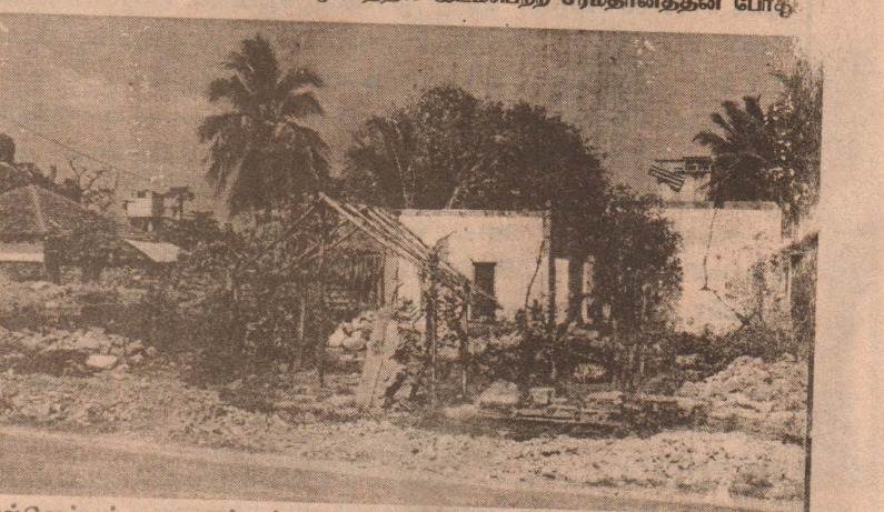
வல்லிவாழ்வுக் குறை அம்மன் கோவிலடியில் படையினரால் யுத்த காலத்தில் அழிக்கப்பட்ட வீடுகளையும், மீளவும் குடியிருக்க கல்வீடு கிருந்த இடத்தில் மணல் வீடு அமைக்கப்படுவதையும் படத்தில் காணலாம்.