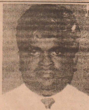
ஐ.சி.ஆர்.சி சகல ஆயுதக்குழுக்களையும் கேட்டுக்கொண்டுள்ளது. (பி)

கிடைக்கவில்லை. ஈராக்கிய பொலிஸாரும் சுட்டுப் படைகளும் விசாரணைகள் நடத்தி வருகின்றார்கள். அவர்கள் பிரயாணம் செய்த வாகனத்தில் சென்றிருந்த சிலுவை அடையாளம் தெளிவாகப் பொறிக்கப்பட்டிருந்தது. ஈராக்கில் தனது எதிர்கால செயற்பாடுகள் பற்றி ஆராயும் நோக்கத்தோடு தாக்குதலின் சூழ்நிலைகள் பற்றி ஐ.சி.ஆர்.சி இப்பொழுது ஆராய்ந்து வருவதாக அறிவித்துள்ளது. செஞ்சிலுவைகளுடனும், செஞ்சிலுவை சின்னங்களுடனும் பணி புரியும் ஊழியர்களும் வாகனங்களும் பத்திரமாக போக்குவரத்துச் செய்யவும் உயிர்காக்கும் பணிகளை மேற்கொள்ளவும் அனுமதிக்குமாறு