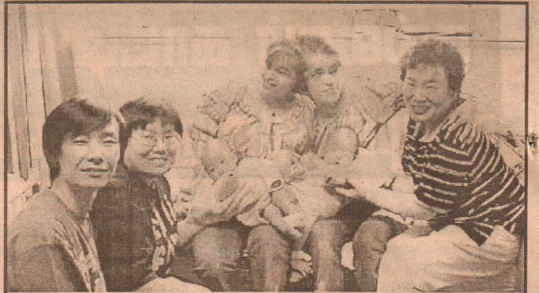
தலை ஓட்டியிருந்த ஈரானிய இரட்டைச் சகோதரிகள் அறுவைச் சிகிச்சைக்காக சிங்கப்பூர் மருத்துவமனையில் அனுமதிக்கப்பட்டிருந்தபோது, கிடுப்பு ஓட்டியிருந்த இரட்டைக் குழந்தைகளை மடியில் வைத்து கொஞ்சிய காட்சி. இரட்டைச் சகோதரிகளின் அறுவைச் சிகிச்சை தோல்வியுற்றாலும், இக்குழந்தைகளின் அறுவைச் சிகிச்சை வெற்றிகரமாக முடிந்தது.

சதாமின் புதல்வர்கள் பற்றிய இரகசியத் தகவல் கொடுத்த ஈராக்கியர் தற்பொழுது பாதுகாப்புக் கைதயாக வைக்கப்பட்டுள்ளார் என்று அதிகாரிகள் கூறினர். (பி) சதாமின் குரல் மீண்டும் ஈராக்கில் ஒலிக்கிறது ஈராக்கின் ஆட்சியிலிருந்து பதவி கவிழ்க்கப்பட்ட சதாம் ஹுசைனின் பேச்சு அடங்கிய ஒலிநாடாவொன்றை அரபுத் தொலைக்காட்சி ஒன்று ஒலிபரப்பியுள்ளது. அதில் பேசிய சதாம், அமெரிக்காவின் ஆக்கிரமிப்பை எதிர்த்து ஒன்றுபட்டுப் போரிடுங்கள், அமெரிக்காவால் உருவாக்கப்படும் ஈராக்கிற்கான இராணுவத்தினருக்கு ஒத்துழைப்பு வழங்க வேண்டாம். ஈராக் தலைநகர் பத்தாத்தை கடந்த ஏப்ரல் 9ம் திகதி அமெரிக்கக் கூட்டுப் படையினர் கைப்பற்றினர். இதையடுத்து எனது பாத்தகட்சியையும் நாட்டு மக்களையும் பகைவர்களை எதிர்த்துப் போரிட வேண்டுமென அறிவுறுத்தினேன். தற்போதும் அவர்களுடன் தொடர்புகொண்டு இந்த அறிவுறுத்தலை விடுத்து வருகின்றேன். இந்நிலையில் ஈராக் மீது போர் இன்னும் முடியவில்லை என்று அமெரிக்கா கூறுகின்றது. ஒரு வகையில் இதனை நான் வரவேற்கின்றேன். எனது கட்சி இன்னும் பிளவுபடவில்லை. மக்களின் உறுதி தளரவில்லை என்று கூறினார். கடந்த காலங்களில் சதாம் ஹுசைன் பேசியதாக வந்த ஒலிநாடாக்கள் அவரது நிஜமான குரல் என்று உறுதி செய்யப்பட்டது. அத்துடன் அவற்றைக் கட்டாரிலுள்ள அல்-ஜஸீரா தொலைக்காட்சி ஒலிபரப்பியது. ஆனால் இந்த ஒலிநாடா சதாமினுடையது என்று இன்னும் உறுதி செய்யப்படவில்லை என கூறப்படுகின்றது. (பி-2)