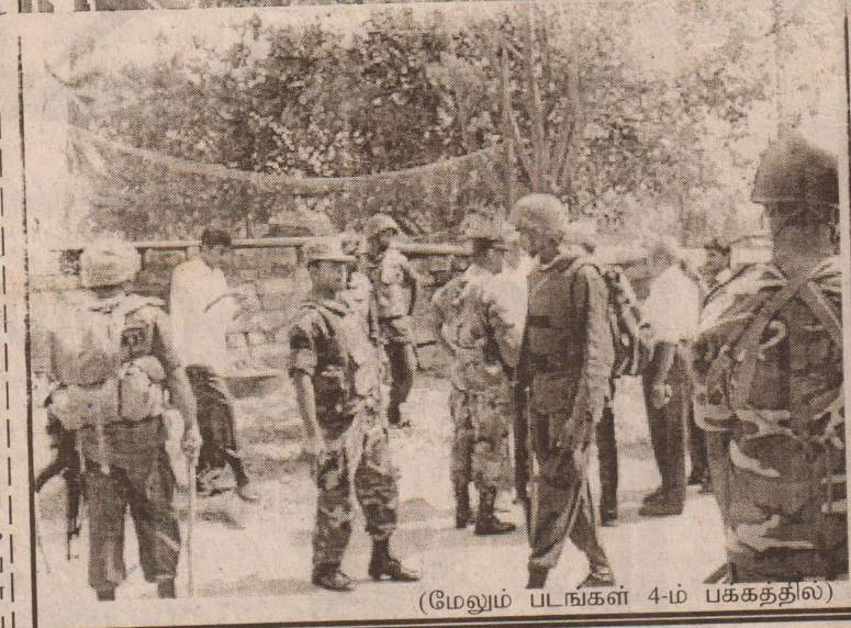
(மேலும் படங்கள் 4-ம் பக்கத்தில்)