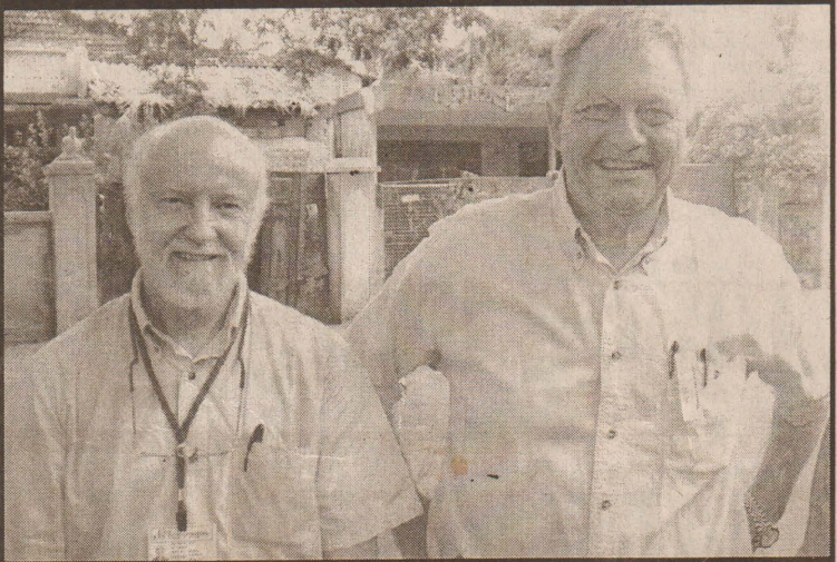
யாழ்ப்பாணம் கன்னியர் மடம் சந்திப்புகளில் பாதுகாப்புப் பணியில் ஈடுபட்டுள்ள படையினரை முதலாவது படத்திலும், பிரதான வீதியில் காவலரண் ஊடாகச் செல்லும் முச்சக்கர வண்டிச் சாரதியைப் பொலிஸார் ஒருவர் விசாரணைக்குட்படுத்துவதை இரண்டாவது படத்திலும், கண்காணிப்புப் பணியில் ஈடுபடுவதற்காக நேற்றைய தினம் யாழ்ப்பாணத்திற்கு வரவழைக்கப்பட்டுள்ள கண்காணிப்புக் குழுப் பிரதிநிதிகளில் இருவரை மூன்றாவது படத்திலும் காணலாம்.