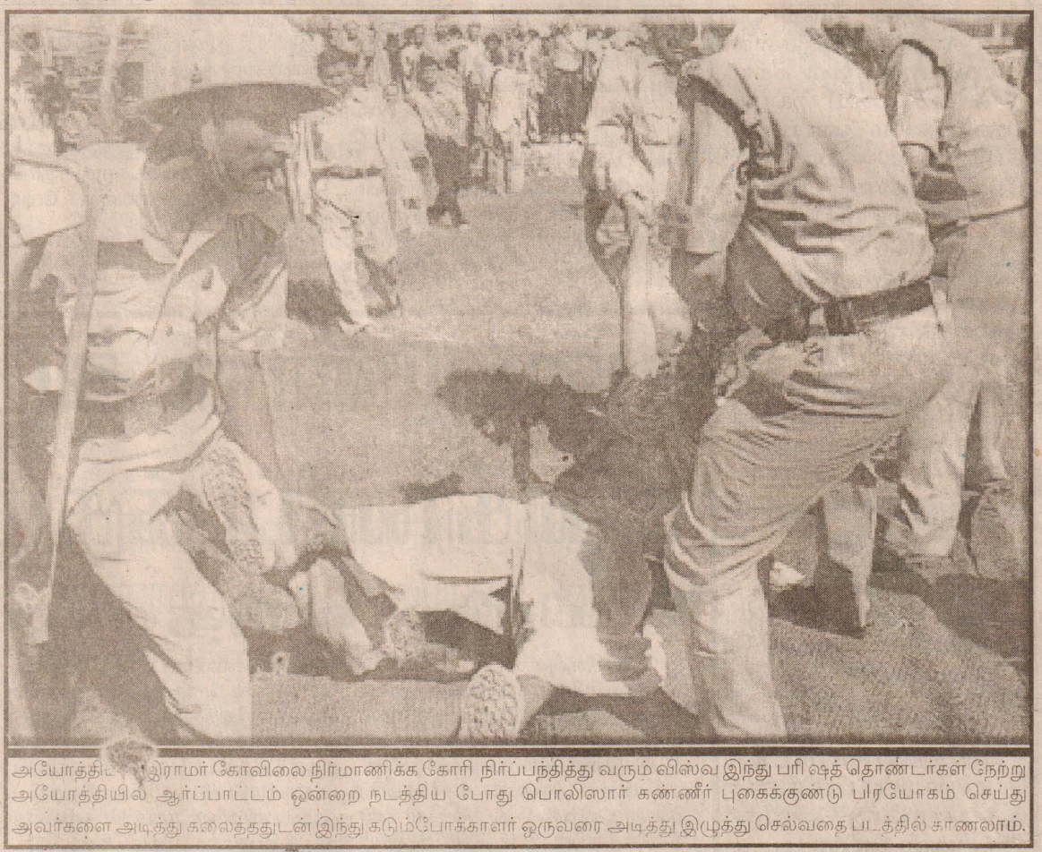
அயோத்தியில் இராமர் கோவிலை நிர்மாணிக்க கோரி நிர்ப்பந்தித்து வரும் விஸ்வ இந்து பரி ஷத் தொண்டர்கள் நேற்று அயோத்தியில் ஆர்ப்பாட்டம் ஒன்றை நடத்திய போது பொலிஸார் கண்ணீர் புகைக்குண்டு பிரயோகம் செய்து அவர்களை அடித்து கலைத்ததுடன் இந்து கடுமீபோக்காளர் ஒருவரை அடித்து இழுத்து செல்வதை படத்தில் காணலாம்.