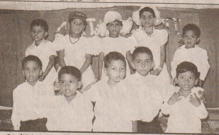
திருநெல்வேலி சீவசக்தி முன்பள்ளி பாடசாலை மாணவர்களின் கலை நிகழ்வில் ஒருகாட்சி.

கடந்த 19ஆம் திகதி இந்தியாவிற்கான விஜயம் ஒன்றை மேற்கொண்டிருந்த பிரதமர் ரணில் விகிரமசிங் கவும் இந்தியப் பிரதமர் வாஜ்பாயும் பொருளாதார ஒத்துழைப்பு ஒப்பந்தத்தில் கைச்சாத்திட்டுள்ளதாகவும், இந்த ஒப்பந்தத்தின் அடிப்படையில் பாரம்பரியமற்ற பொருட்களையும் இந்தியாவிற்கு ஏற்றுமதி செய்ய முடியும் எனவும் தெரிவித்த நிகால் அபயசேகர, இவ் ஒப்பந்தத்தின் இலட்சியத்தை அடைவதற்கென இலங்கை வர்த்தகர்களுக்கும் கைத்தொழிலாளர்களுக்கும் குறைந்த வட்டியில் கடன் வசதிகள் வழங்கப்படவுள்ளதாகவும் அவர் மேலும் தெரிவித்தார். (பி-60,10)