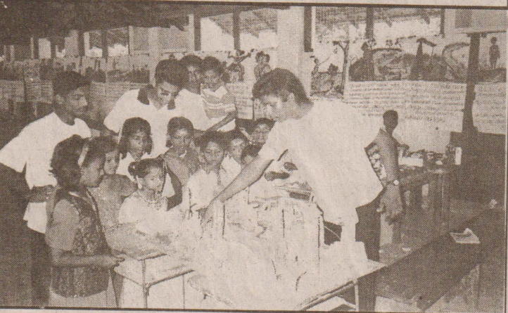
யுனிசெவ் மற்றும் சிறுவர் பாதுகாப்பு நிதியம் ஆகியவற்றின் அனுசரணையுடன், யாழ்ப்பாணம் மாவட்ட சிறுவர் கழகங்களின் இணையம் அண்மையில் கொடிகாமம் திருநாவுக்கரசு மகாவித்தியாலயத்தில் நடத்திய மீதிவிவடி வழிப்புணர்வுக் கண்காட்சியின் போது எடுக்கப்பட்ட படம்.