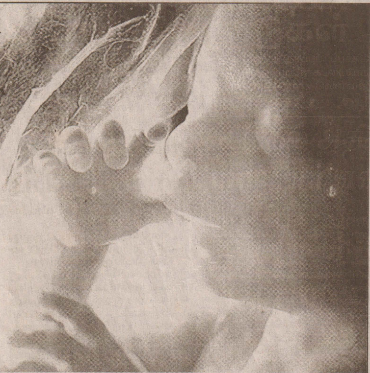
குழந்தைகள் தாயின் கருவில் இருக்கும்போதே விரலைச் சப்பிச் சுவைக்கும் பழக்கத்தை ஆரம்பித்து விடுகின்றனவாம். கிதனை நிறுப்பும் வகையில் சுவீடன் புகைப்பட நிபுணர் ஒருவர் தாயின் கருப்பைக்குள் இருக்கும் போது தனது விரலைச் சப்பிச் சுவைக்கும் குழந்தையை படமாக்கியுள்ளதையே இங்கு காண்கிறீர்கள்.

தீர்மானித்துள்ளது. கடந்த செப்டம்பர் மாதம் கராச்சியில் வைத்து இவர்கள் 20 பேரும் சந்தேகத்தின் பேரில் பொலிஸாரினால் கைது செய்யப்பட்டனர். தீவிர விசாரணைக்குட்படுத்திய பின்னரே இவர்களை நாடுகடத்த முடிவு செய்ததாக பாகிஸ்தானிய பாதுகாப்பு அமைச்சு தெரிவித்துள்ளது. (பி-2)