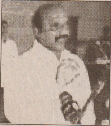
மலையக மக்கள் முன்னணியின் தலைவரும், பெருந்தோட்ட உட்கட்டமைப்பு அமைச்சருமான பெ.சந்திரசேகரன் இவ்வாறு தெரிவித்துள்ளார்.

சிறுபான்மையினத்தவரான நாங்கள் தனியான ஓர் அலகு வேண்டும்