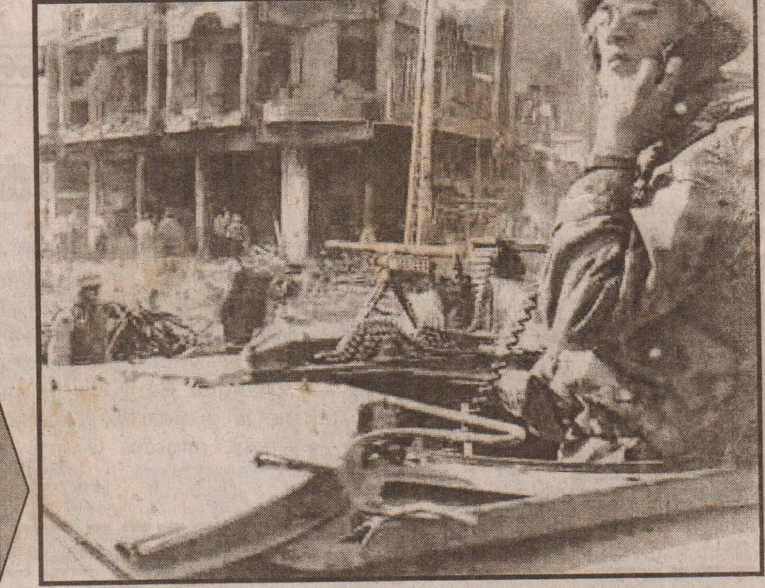
ஈராக் தலைநகர் பாக்தாத்தில் நேற்று நேற்றுமுன்தினமும் இடம்பெற்ற தொடர் குண்டுத் தாக்குதலில் இடிந்த நிலையில் உள்ள செஞ்சிலுவைச் சங்கக் கட்டடத்தைப் படத்தில் காணலாம். (செய்தி 4ம் பக்கத்தில்)

மக்களுக்கான பிரஜைகள் குழுவினால் ஏற்பாடு செய்யப்பட்டுள்ள இவ் எழுச்சிப் போராட்டத்தில் யாழ்ப்பாணம், கிளிநொச்சி, முல்லைத்தீவு மற்றும் மன்னார் மாவட்டங்களிலிருந்து வெளியேற்றப்பட்டு தற்போது புத்தளம் மாவட்டத்தில் வசித்துவரும் முஸ்லிம்கள் கலந்து கொள்ளவுள்ளனர். (உ-16)